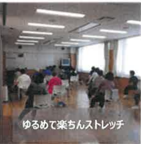
ゆるめて楽ちんストレッチ