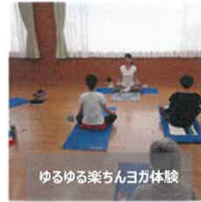
ゆるゆる楽ちんヨガ体験