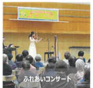
ふれあいコンサート