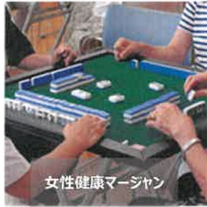
女性健康マージャン