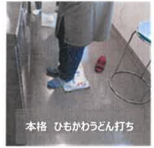
本格 ひもかわどん打ち