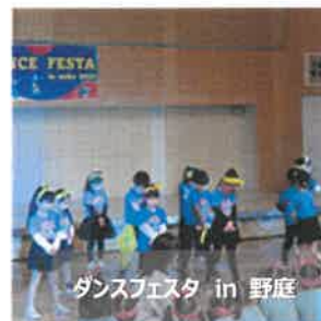
ダンスフェスタ in 野庭