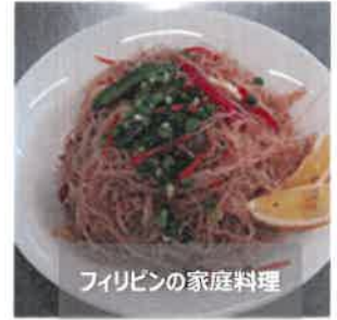
フィリピンの家庭料理