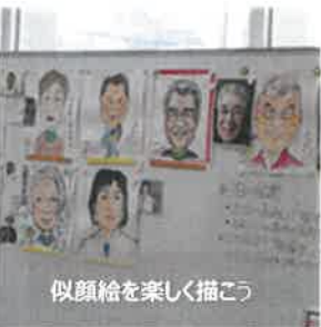
似顔絵を楽しく描こう