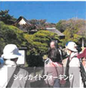
シティガイドウォーキング