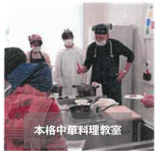
本格中華料理教室