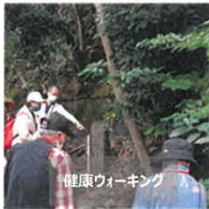
健康ウォーキング