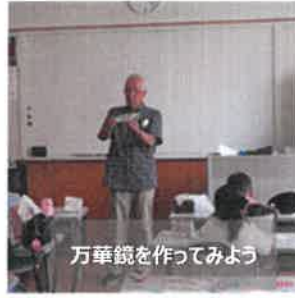
万華鏡を作ってみよう