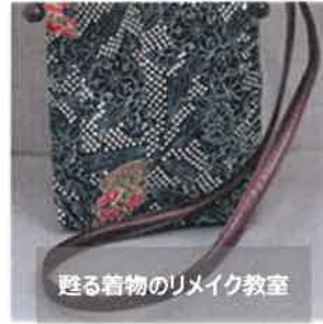
甦る着物のリメイク教室