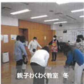
親子わくわく教室 冬