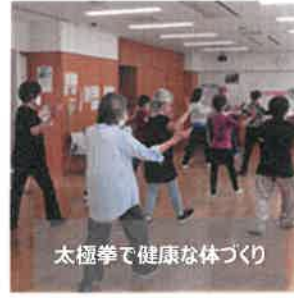
太極拳で健康な体づくり