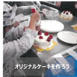
オリジナルケーキを作ろう