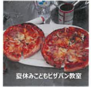
夏休みこどもピザパン教室