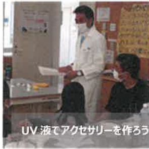
UV液でアクセサリを作ろう