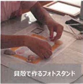
貝殻で作るフォトスタンド