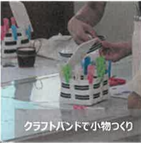
クラフトバンドで小物づくり