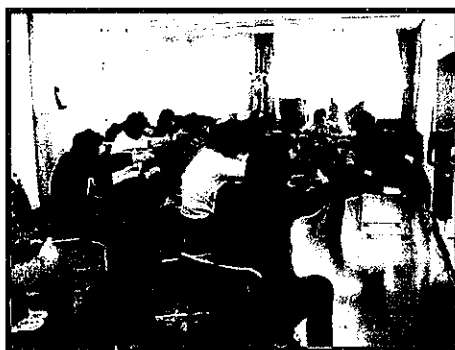
『いつまでも自分らしく！ 生き生き体操』