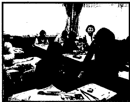
『リバーシブルベスト着物リメイク』