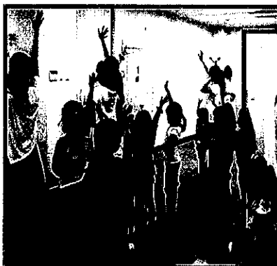
『キッズダンスAコース』