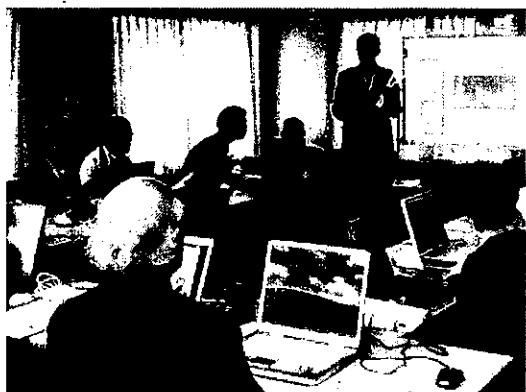
『暮らしに役立つインターネット』