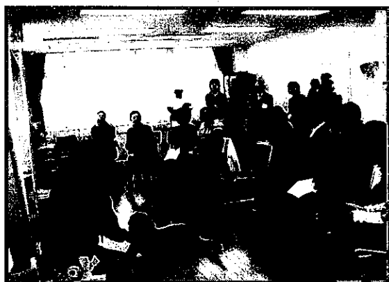
『ペットのしつけ方教室』