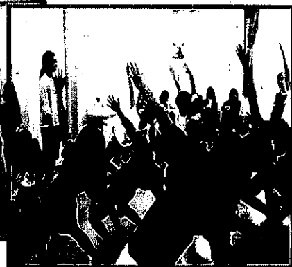
『キッズダンスBコース』