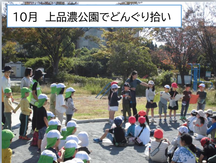
10月 上品濃公園でどんぐり拾い