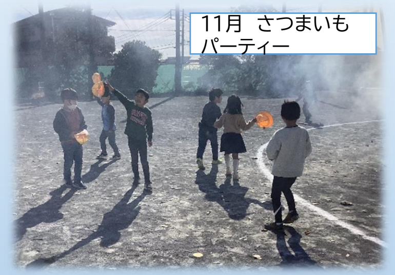
11月 さつまいもパーティー

【仲間意識の芽生え】 最初は、躊躇していた子も積極的に声をかけるようになりました。