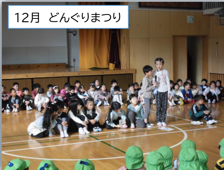
12月 どんぐりまつり