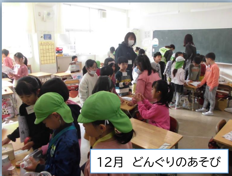
12月 どんぐりのあそび