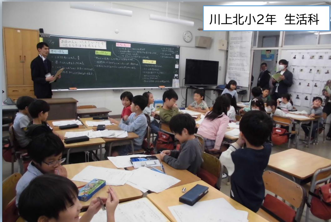
川上北小2年 生活科