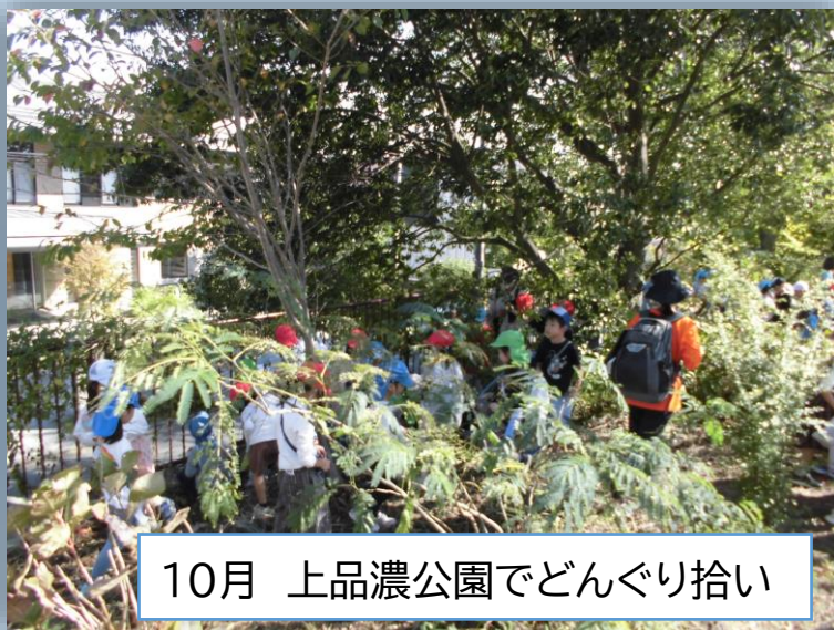
10月 上品濃公園でどんぐり拾い