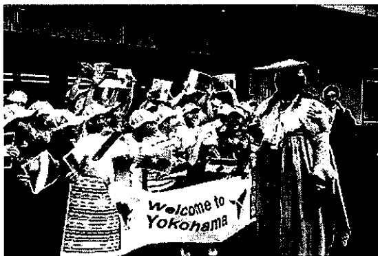
戸部小学校児童による会議参加者のお出迎え [8月28日・パシフィコ横浜 会議センター前]