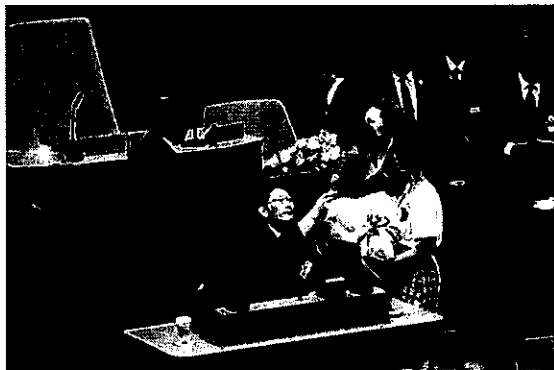
コートジボワール首相議場演説での 桜岡小学校児童による歓迎

「アフリカとの一校一国」参加校が、国際局等が行った関連プログラムに参加しました。