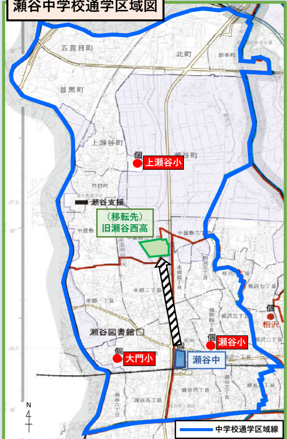
瀬谷中学校通学区域図