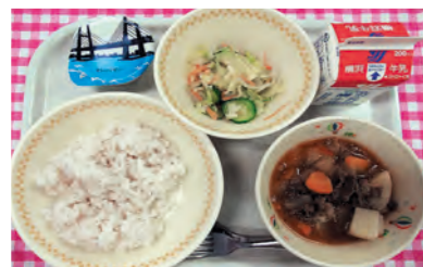
麦ごはん、牛乳、ピカジーニョ、 野菜サラダ、オレンジゼリー