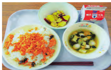
秋味ごはん、牛乳、 さつまいもと栗の甘煮、すまし汁