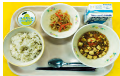
はいがごはん、牛乳、麻婆豆腐、 中華あえ、ラフランスゼリー