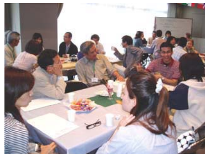
チュータープログラム説明・交流会

実施日：5月17日（日） 会 場：国際学生会館ホール 参加者：市民 29人 留学生 14人