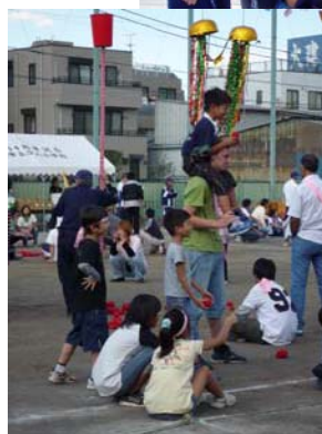
潮田西部地区体育大会