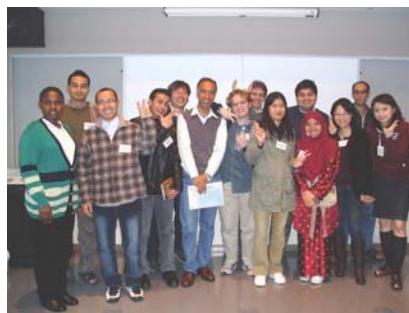
留学生と英語で語ろう！（スタッフ）