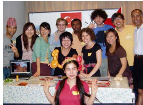
秋まつり（国際喫茶）