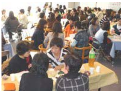
留学生と韓国朝鮮語で語ろう！