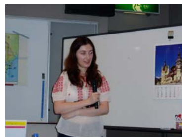
もっと知りたい魅惑の国ルーマニア