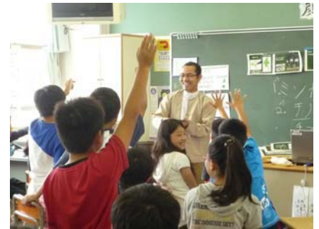
留学生による出前授業