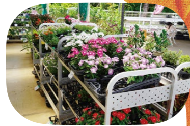
季節の花が並びます。手前は晩秋まで咲くニチニチソウ

10軒の農園から花が集まるJA(農業協同組合)の直売所です。秋の人気はパンジー/ビオラ。11月から直売の最盛期を迎え、「シクラメンまつり」も同店で開催。家庭向けの肥料や土も売っているので、花を初めて育てる人にもおすすめです。