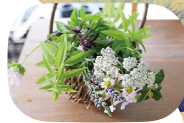
収穫体験では貸し出しのカゴいっぱいハーブを摘めます。鑑賞用にも

国内でも数少ないハーブ専門農園。約300坪の敷地に80種の苗が並びます。おすすめはタイム。肉、魚、野菜と相性が良く、焼いても煮込んでもよし。直売の他に、予約不要の収穫体験も随時受け付けています。