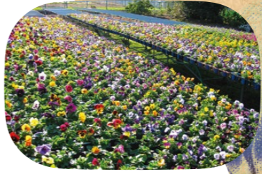
レーンに並ぶパンジー/ビオラ

パンジー/ビオラの花苗、ポチュラカやシクラメンの花鉢などを生産・直売しています。冬の主力であるシクラメンは底面給水の鉢で、初心者も管理しやすいそう。咲き始めから楽しめる直売ならではの魅力をお客さまに伝えています。