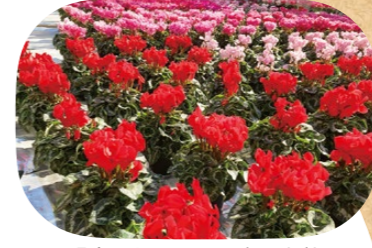
見渡す限りのシクラメン。色もさまざま

160坪ほどの敷地に、2,800鉢のシクラメンが並ぶ様は圧巻。自分好みの花を選べるそう。花は立ち、葉は詰まるように。その姿に、手入れの積み重ねが出ると言います。クリスマスを思わせる赤いシクラメンが人気。