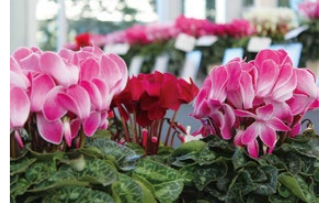
農業振興課公式HP「横浜の花き・植木」

今年で52回目を迎える歴史ある花の品評会です。横浜市のシクラメン生産者は、農林水産大臣賞を受賞した方もいて、生産技術が最高峰です。専門家が厳正に審査し、受賞作品を決定。その後は一般公開されます。