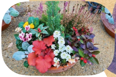
鮮やかな寄せ植え。値段は1,500円~5,000円・税込

花や野菜苗、シクラメンを直売しています。多品種栽培が特徴で、パンジー/ビオラ、コリウスなども生産。これらの花々は里山ガーデン(旭区)の大花壇も飾っています。秋の直売の最盛期は10月中旬からで、寄せ植えも人気です。