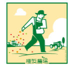
横浜では「横浜農場」を活用し、横浜の農の魅力を活かしてPRしています

花を飾り、緑を愛でる。そんな生活を横浜で叶えましょう。今回は市営交通沿線の花々植物の直売所を紹介。生産者の顔とストーリーが見える草花は、愛着もひとしおです。