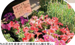
市内の花き生産者が三好種苗から種を買い、苗まで育てた花苗、野菜苗も充実