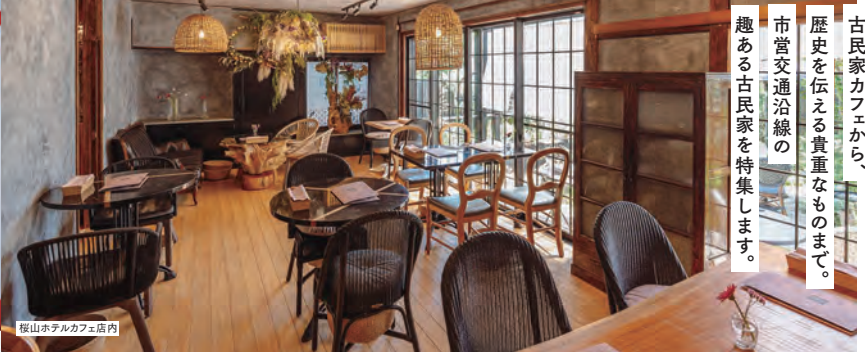
桜山ホテルカフェ店内

横浜市交通局広報誌ぐるっと 夏号 発行日: 令和6年7月31日 ぐるっとのバックナンバーはこちら 発行: 横浜市交通局 総務課 企画・制作: とくろ編集部(株式会社ボイス) <ぐるっと 記事>