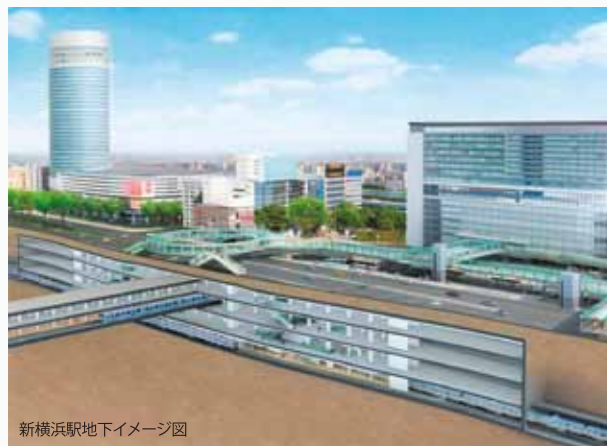
新横浜駅地下イメージ図