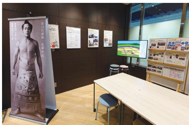
港北図書館 第33代横綱 武蔵山嵐～日吉から大相撲の頂点へ～

※4 ヨコハマライブラリースクール：学術分野で最先端の研究成果を学ぶ「教養講座」、法律や経営など生活上の課題解決に役立つ知識を学ぶ「実用講座」の2シリーズを柱とする総合講座。様々な分野の研究者や専門家から直接話を聞くとともに、テーマに関連する図書に触れることで学びを深める。