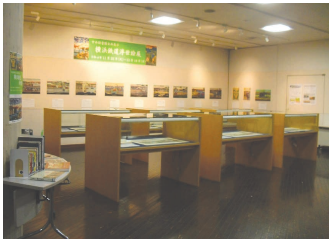
中央図書館 鉄道開業150周年記念 横浜鉄道浮世絵展

11月には、鉄道開業150周年を記念し、汽車を題材とした浮世絵や絵葉書などの貴重資料を活用し、鉄道開業当時を振り返る展示を行いました。この他、市役所各部署や横浜市信用保証協会、神奈川近代文学館などと連携した展示を16回実施しました。また、3、4、5階でテーマを統一した展示を4回実施し、社会科学や自然科学など、各フロアに配架している分野ならではの切り口から多様な図書を紹介しました。