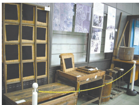
金沢図書館 企画展示「金沢区の埋立と海苔の養殖」