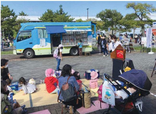
移動図書館 (特別運行 in 金沢まつりいきいきフェスタ)

オ 令和4年2月に開設したツイッターアカウント「はまかせ号(横浜市移動図書館)@lib_hamakaze」において、日々移動図書館の運行情報を迅速に発信しました。