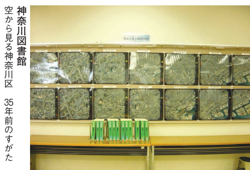
神奈川図書館 空から見る神奈川県 35年前のすがた