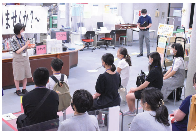
旭図書館 ビブリオバトル@旭図書館