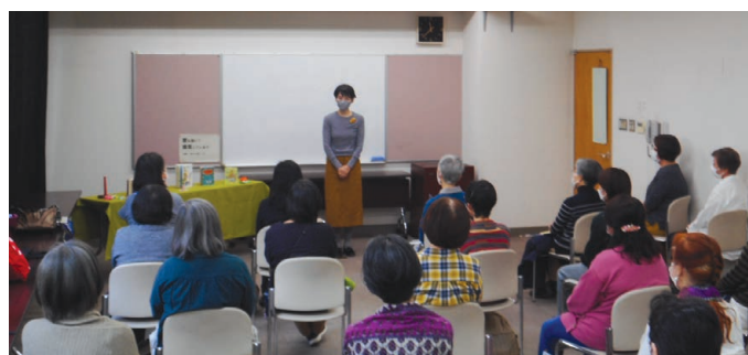
中図書館 大人のためのおはなし会