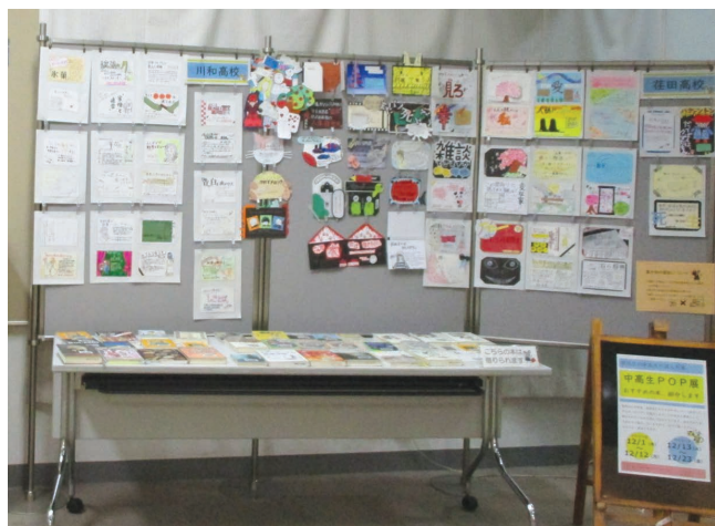
都筑図書館 POP展示 都筑区中高生による本の紹介展示