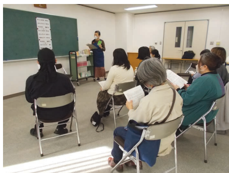
保土ヶ谷図書館 ストーリーテリング講習会