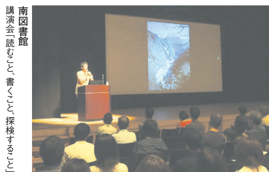
南図書館 講演会「読むこと、書くこと、探検すること」