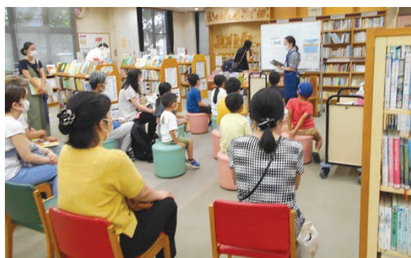
港南図書館 なつやすみ！いろんなたのしい本をしょうかいします！