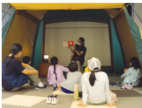
保土ヶ谷図書館 テントのなかのおはなし会