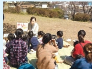
「出前としょかん」の様子

さらに、子どもの身近な場所での読書を推進するため、学校司書、学校ボランティア向けの研修の実施、学校図書館の環境整備を支援するなど、学校連携事業も積極的に行っています。