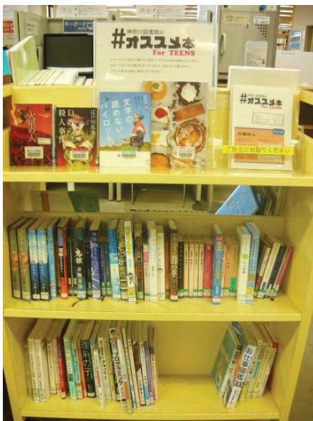
神奈川図書館 #神奈川図書館のオススメ本 For TEENS