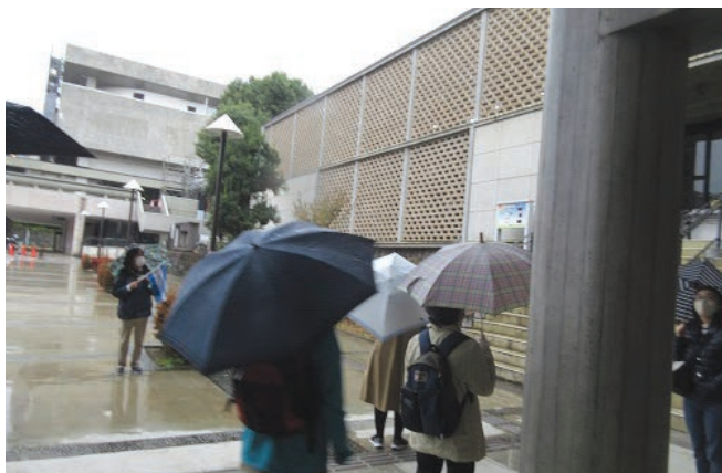
中央図書館 い・にし・え散歩 前川國男の建築を巡る

ウ 中央図書館では、西区役所、野毛山動物園、横浜能楽堂、神奈川県立音楽堂、かなっくホール(横浜市神奈川区民文化センター)、にしとも広場(にしく市民活動支援センター)、スマイル・ポート(西区地域子育て支援拠点)、NPO 法人横浜シティガイド協会など、地域の関係機関・団体と連携したおはなし会、図書展示、歴史散歩などを実施し、地域の読書活動支援や市民の図書館利用促進を図りました。