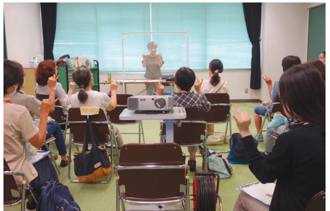
瀬谷図書館 「わらべうたと絵本の会」ボランティア講座

瀬谷図書館では、「わらべうたと絵本の会」ボランティア講座を実施し、親子向けの「ひよこのおはなし会」の活動に参加するボランティアを養成しました。