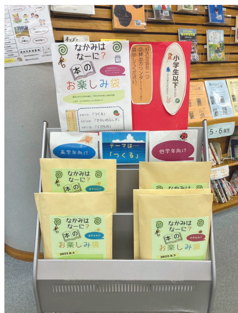
泉図書館 なかみはな-に? 本のお楽しみ袋

オ 中央図書館では、児童書の挿絵画家を招いた飛び出だすカードの製作や、司書による百科事典や図鑑を活用した調べ学習のワークショップを開催し、夏休みの子どもたちの自由研究や課題取組を支援しました。