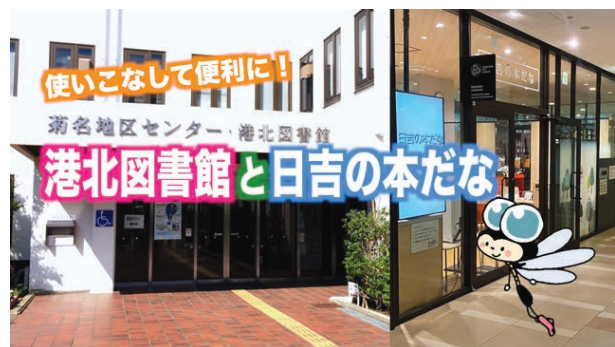
港北図書館 PR 動画「港北図書館と日吉の本だな」