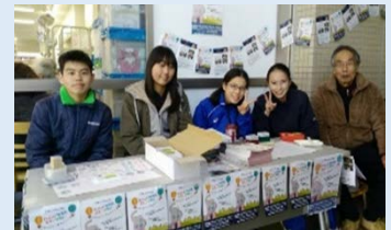
スタンプラリーの様子

【効果】中高生は地域課題を自分事として捉えるようになり、コミュニケーション意欲や技術が向上しました。サポーターとしての大人は、これまでほとんど接点がなかった地域の活動に参画し、新たなネットワークを構築することができました。地域参加のきっかけのつかめないシニア人材の高い能力・意欲を活用することにより、子どもの多い青葉区での青少年健全育成や多世代交流の促進につながりました。