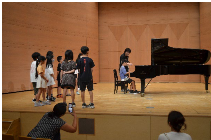
ピアノの演奏をして、音響反響板の効果体験