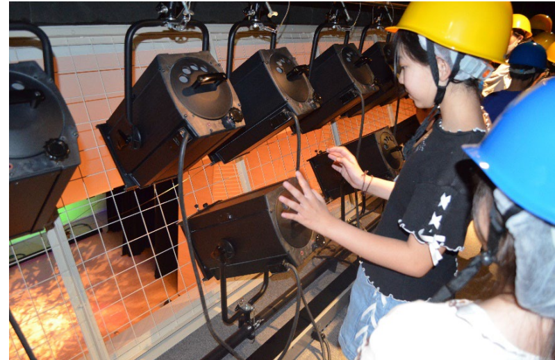
照明設備(シーリングライト室)見学