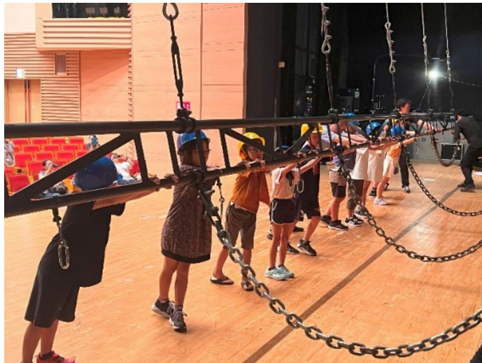
舞台上で音響反響板の撤収体験

ホール内(舞台・音響・照明説明)⇒調整室⇒シーリング室・キャットウォーク⇒舞台上(音響反響板・ピアノ・記念撮影)⇒振り返り会(客席内)