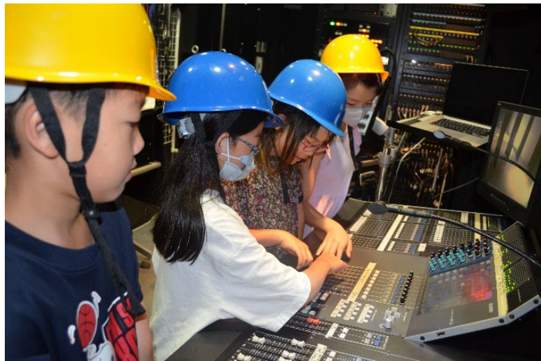
音響調整卓の操作体験