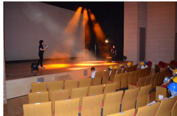
舞台上で、照明効果の説明