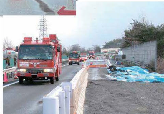
応急復旧の現場を通行する緊急車両 (東北道 福島飯坂 I C～国見 I C)