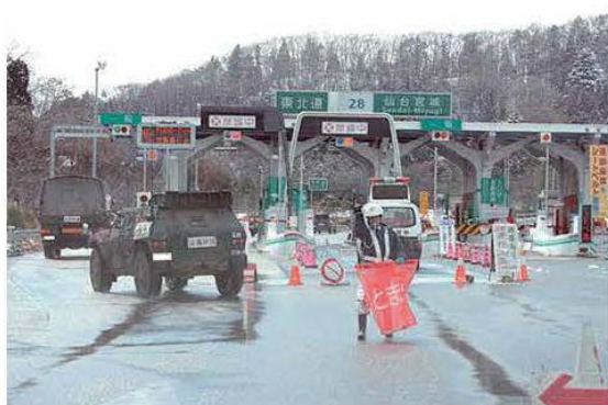
自衛隊車両の通行 (東北道 仙台宮城 I C)

横環が整備されると、地震などの災害時には、東名高速道路や横浜横須賀道路などと一体となって、緊急輸送路としての役割が期待されます。