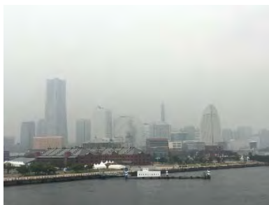
PM2.5 高濃度時（40～50[ \mu\text{g}/\text{m}^3 ] （平成29年10月11日、大棧橋より）