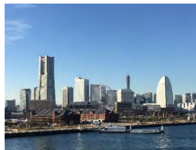
PM2.5 低濃度時（10[ \mu\text{g}/\text{m}^3 ]以下） （平成29年12月28日、大棧橋より）