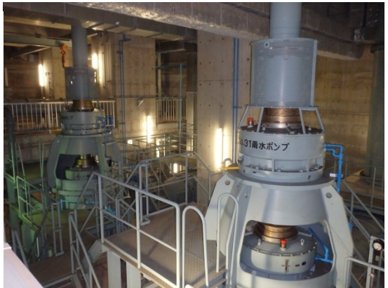
第二ポンプ施設 雨水ポンプ