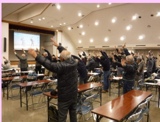
←ハマトレを全員で体験した際の写真