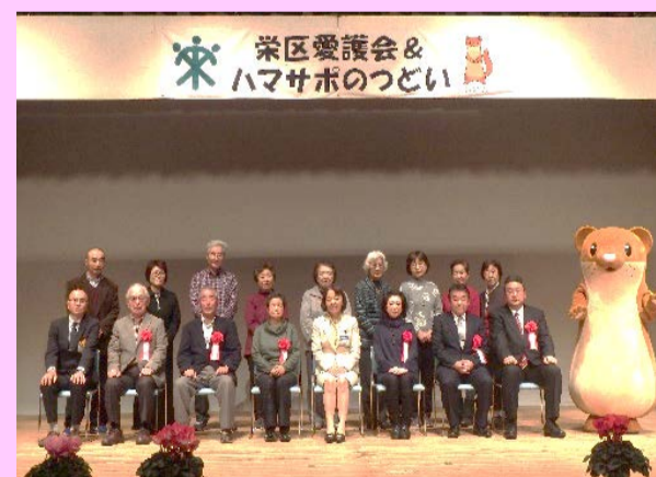
← 表彰された 6団体の 集合写真