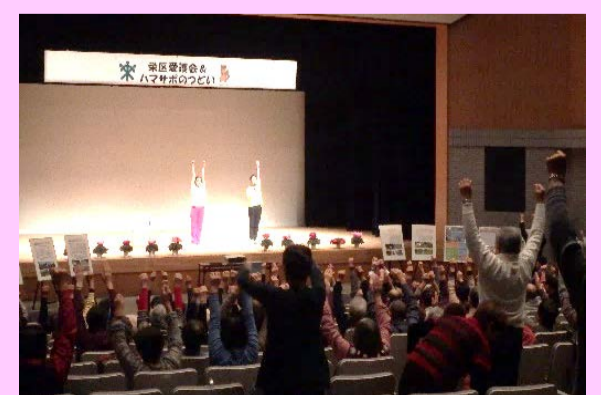
正しいラジオ体操を全員で実施した際の写真→