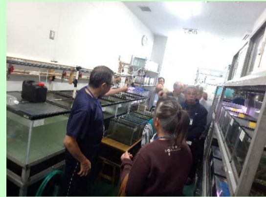
←環境科学研究所の施設見学

今後も皆様の活動に活かせるようなイベントをできるように努力いたします。次年度もご参加を心よりお待ちしております。