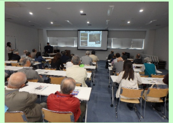
講義室にて 質問への回答中→