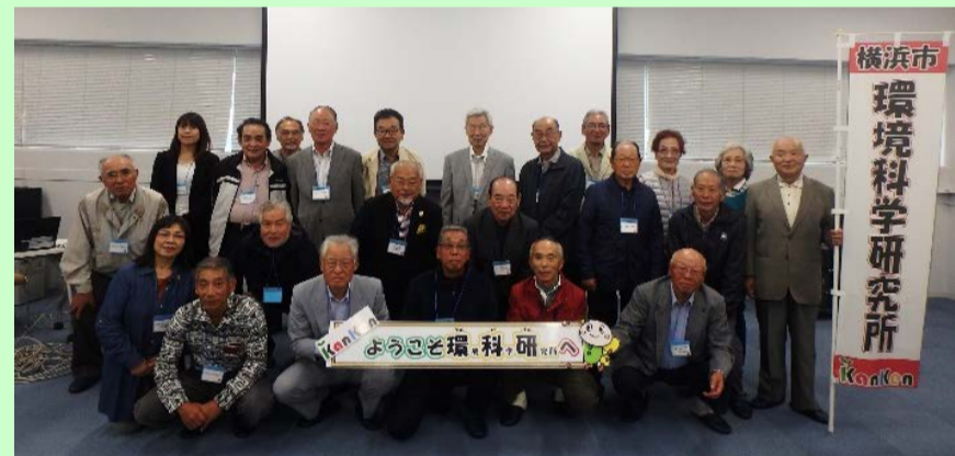
←プログラム終了後の 集合写真