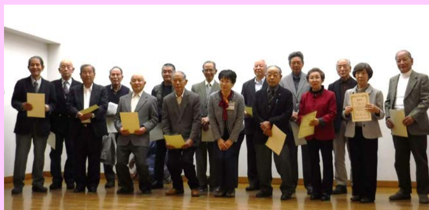
↑表彰された水辺愛護会の6名と他団体の表彰者を含めた集合写真

表彰後、相模原市の公園を見学に行った泉土木事務所主催のバスツアーの報告、造園業者による樹木剪定の講座、ストレッチと筋トレを組み合わせたハマトレの体験などが行われました。