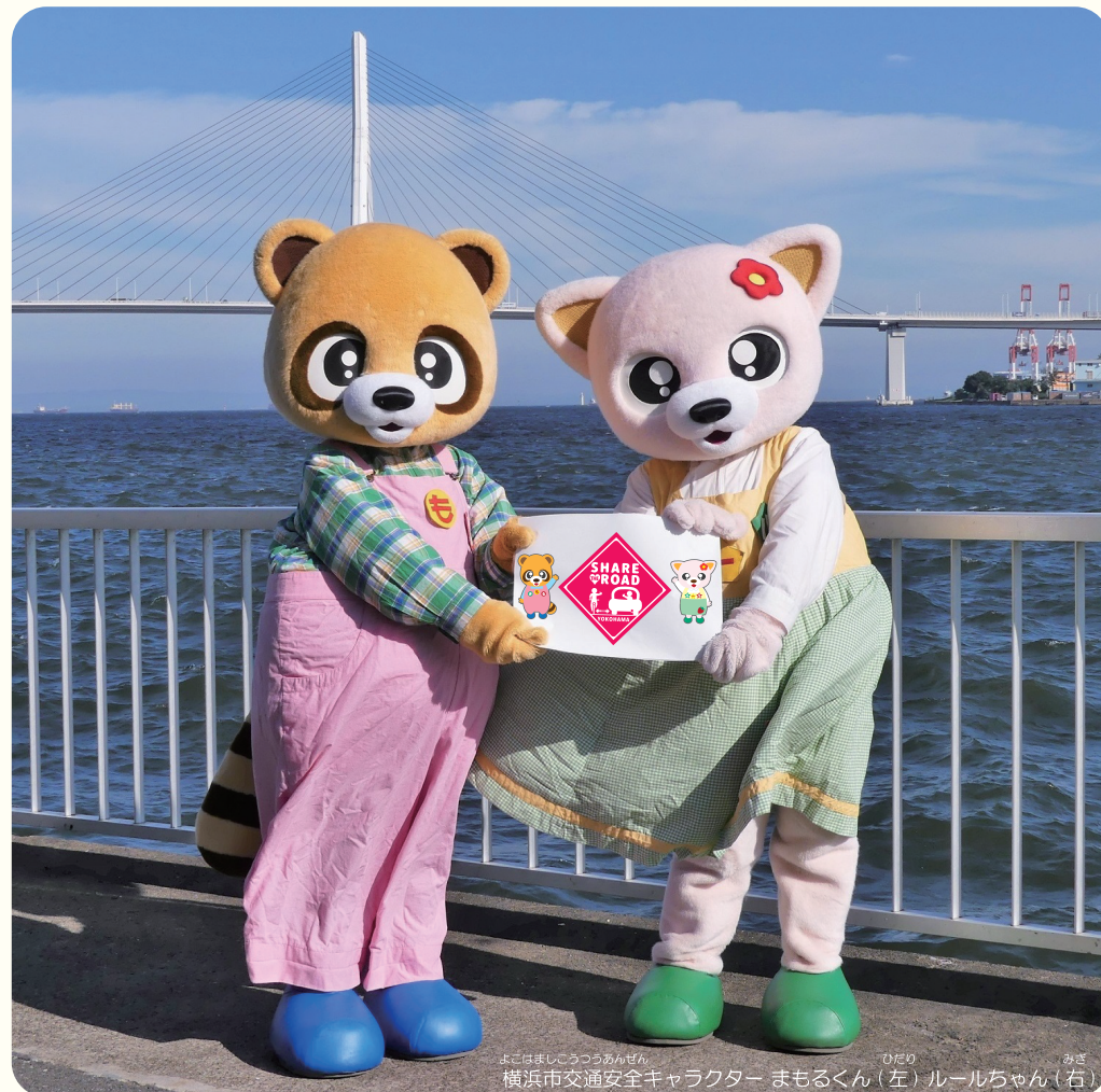
よこはましこうつうあんぜん ひとみ 横浜市交通安全キャラクター まもるくん(左) ルールちゃん(右)