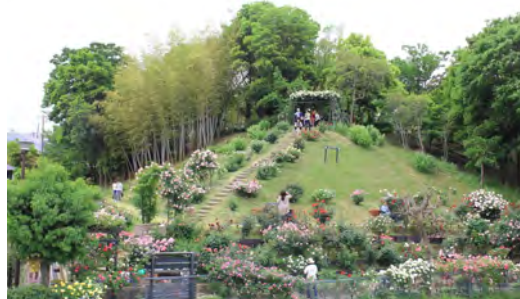
荇子田太陽公園（バラ園）全景

さらに、10月28日 一般社団法人日本公園緑地協会主催の「第36回都市公園等コンクール」においても「国土交通省都市局長賞」を受賞されました！ おめでとうございます！