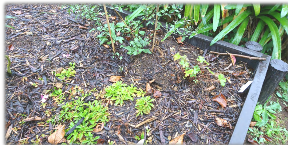
花壇にウッドチップでマルチングを行った例