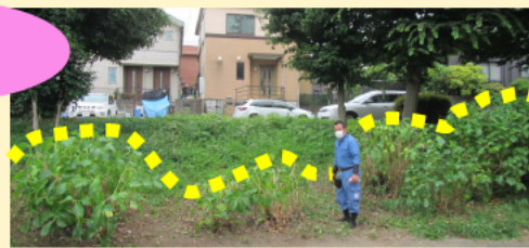
2023年7月13日 講習前 (都筑区 平台くりのみ公園)