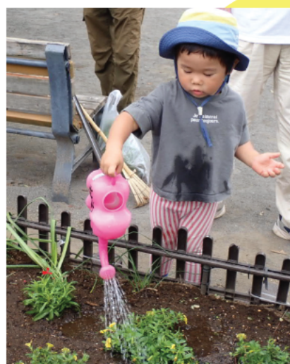
公園に来ていた男の子 楽しそうに水をあげている