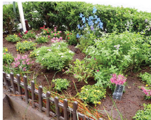
嬉しそうに咲いている花達