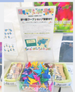
里山ガーデンフェスタ2023で開催したワークショップ

公園の維持管理・公園愛護会通信の配布部数に関するお問合せは、各土木事務所・公園緑地事務所をお願いします。