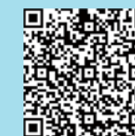
公園愛護会マニュアルのQRコード