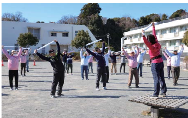
タオルを使うとストレッチがしやすくなります 手持ちの幅をかえると、負荷の調整も簡単です