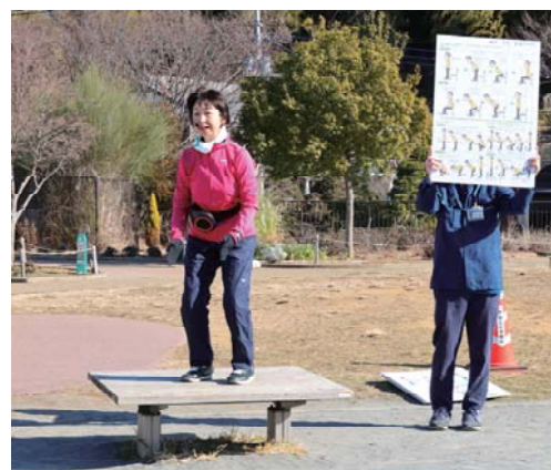
ひざを曲げるときは、ひざを足先と同じ方向に曲げるよう意識しましょう