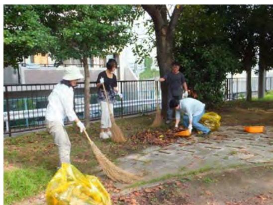
落ち葉拾いの様子