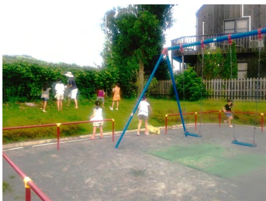
子供たちがごみ拾いをする様子