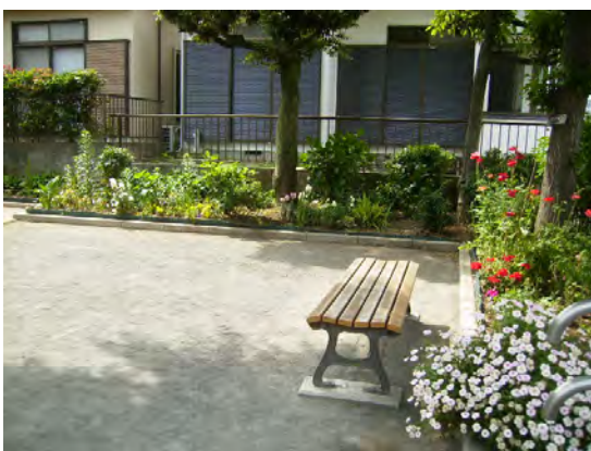
花がベンチを囲み、地域の憩いスポットに