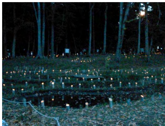
「竹灯籠の夕べ」の様子