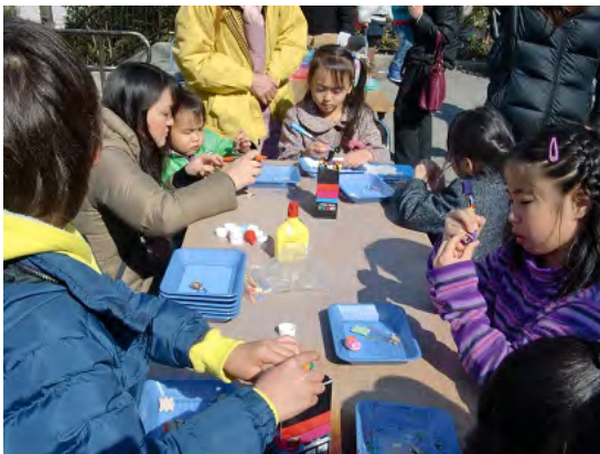
大勢の子供たちが参加して行われた焼き芋大会とクラフトづくり