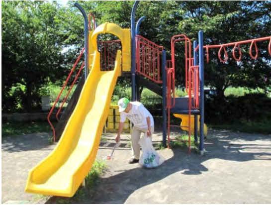
愛護会の帽子をかぶり、隅々までごみ拾い