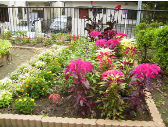
ハゲイトウも種から育てました