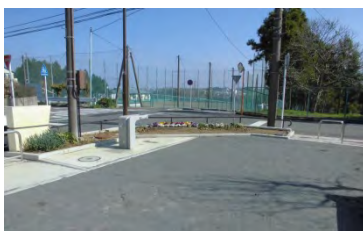
第三公園の 花壇の様子 (花植え前)