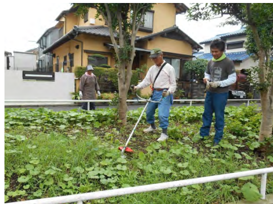
草刈機講習を受講する様子