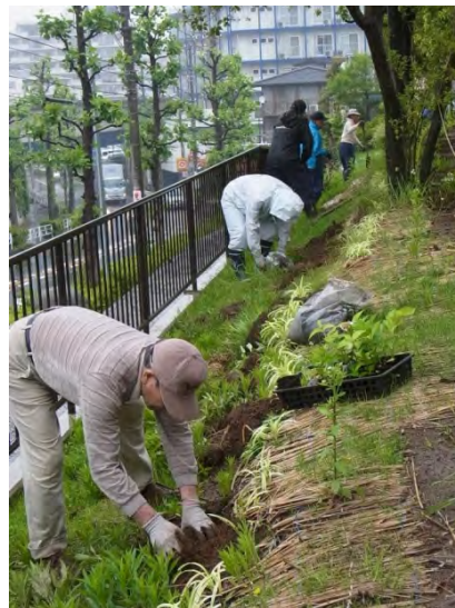
斜面地にアジサイを植えました