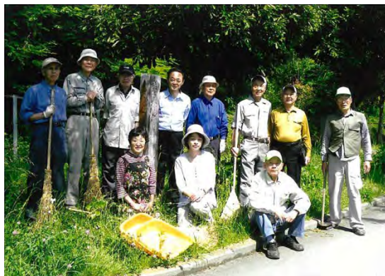
ほかの愛護会からも応援が来ます