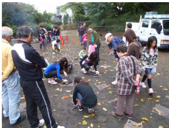
子供会との樹名板づくり