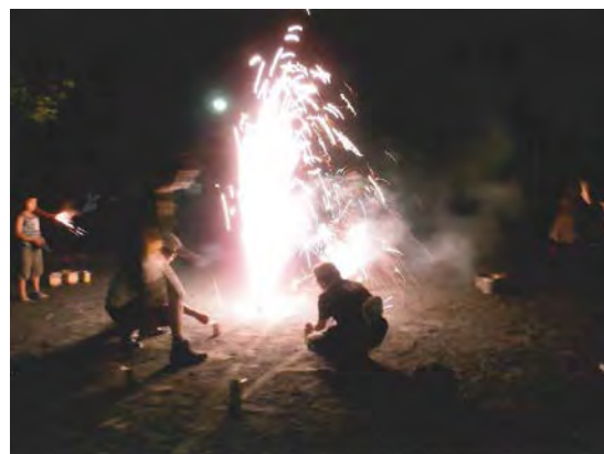
町内会と共に、花火大会などを開催