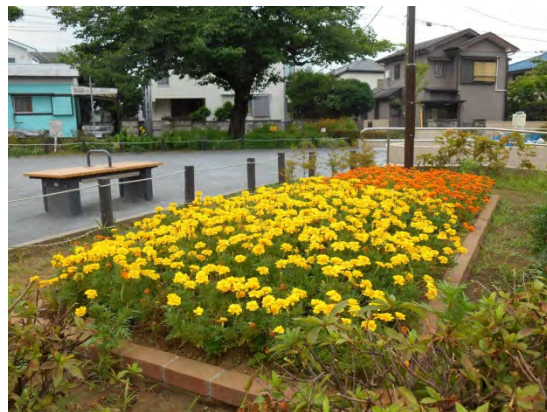
花壇の花が園内を華やかに演出