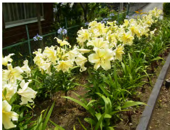
初夏にはユリがいっぱい咲きほこります