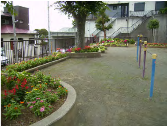
園内を囲む花壇にはいつも花が咲いています