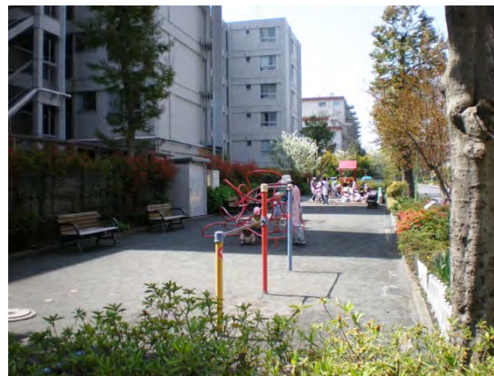
毎日たくさんの保育園児が遊びに来ます