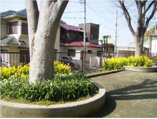
春には菜の花が咲きます