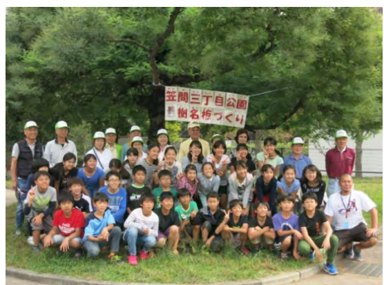
小学生との樹名板づくりの様子