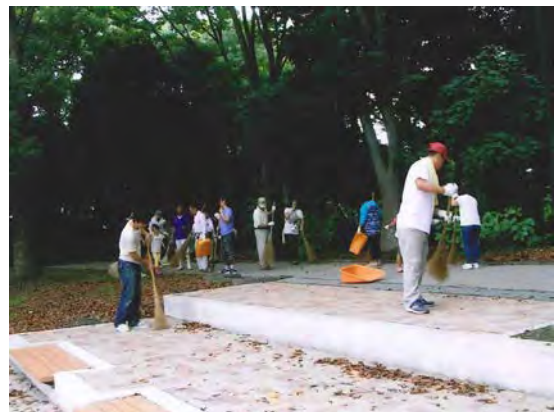
大人数で行う定例清掃の様子