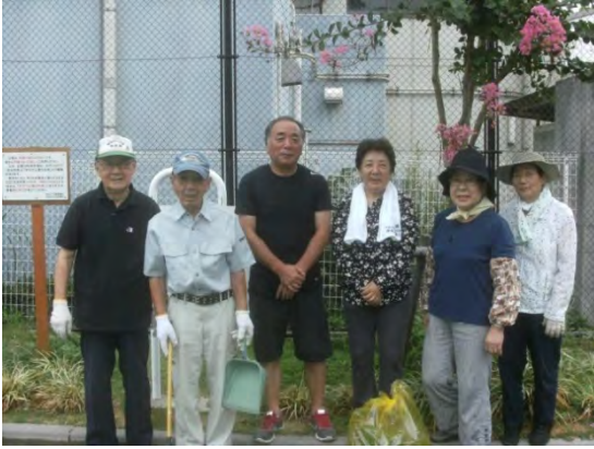
清掃活動後のメンバー