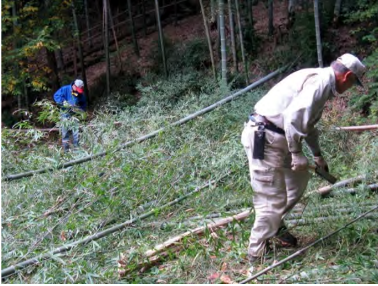
竹林の整備は、間伐と枝払いが大仕事