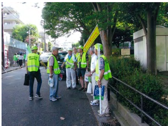
公園を中心に防犯パトロールを実施