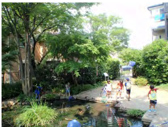
湧水でトンボやザリガニを取る子供たち