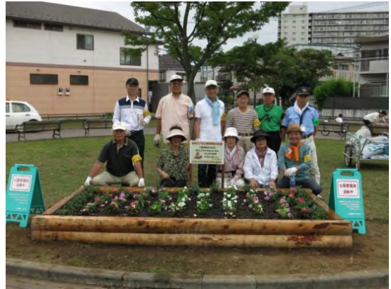
花壇づくりを通じて活動を活性化