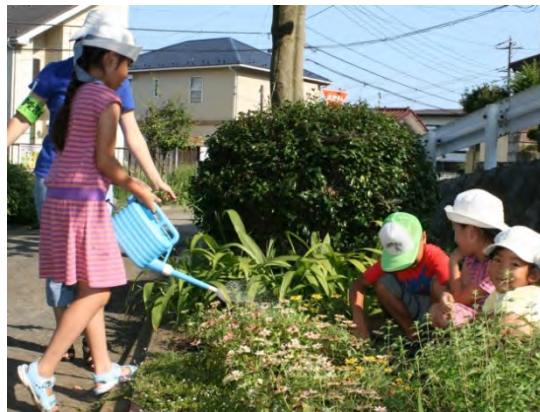
子供たちと花壇を手入れする様子