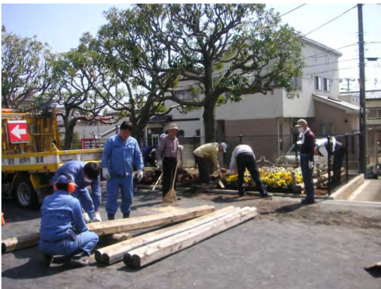
花壇づくりの様子