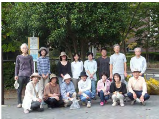
自治会で活動を支えています