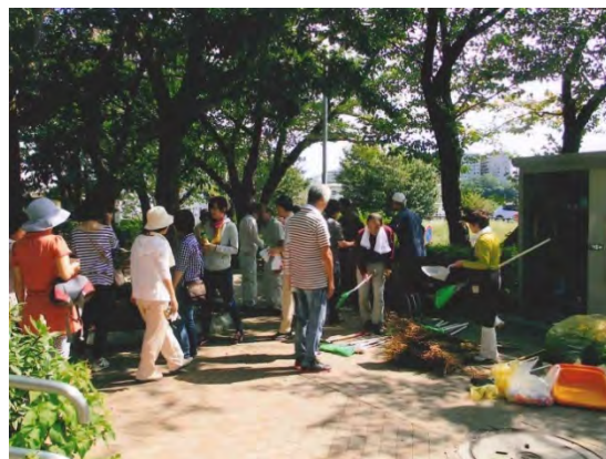
町内一斉清掃の様子