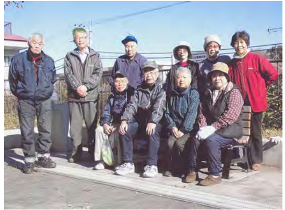
3つの公園を巡回するメンバー