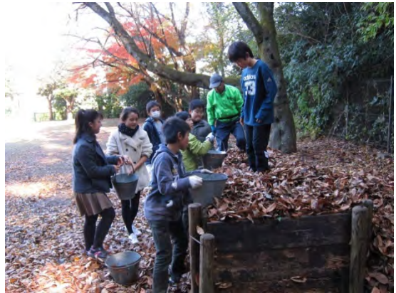
集めた落ち葉を堆肥置き場に運ぶ愛護会員と子供たち