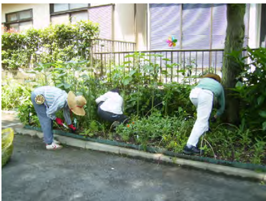
雑草は手で丁寧に抜いていきます