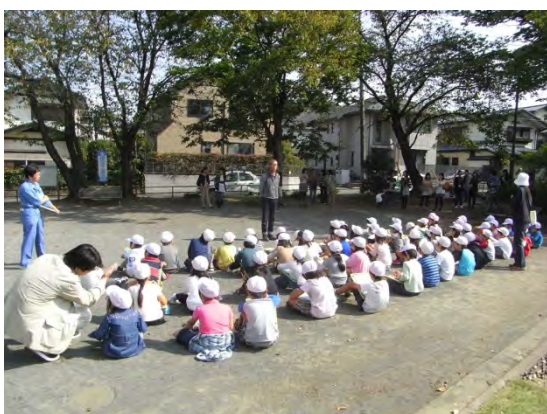
公園での環境学習