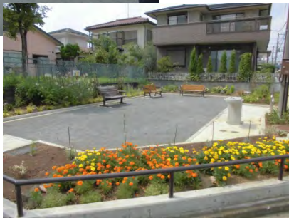
第三公園の 花壇の様子 (花植え後)