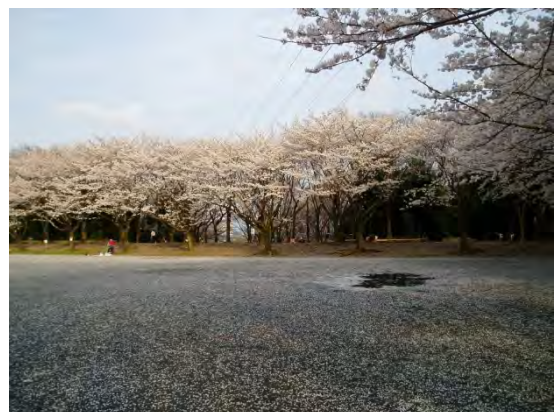
春には見事な桜が咲き誇ります