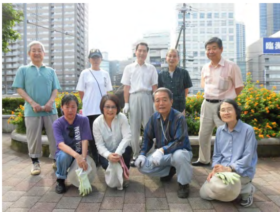
朝の定期清掃にて