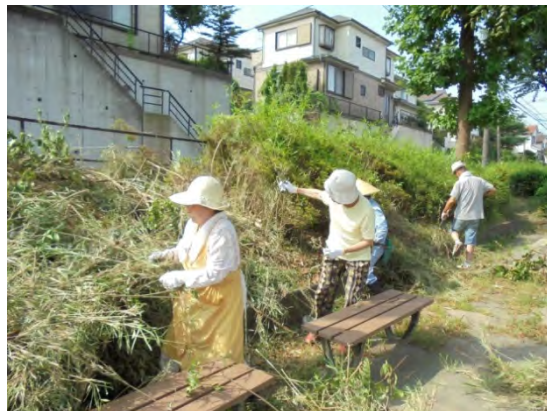
植栽の手入れをする様子