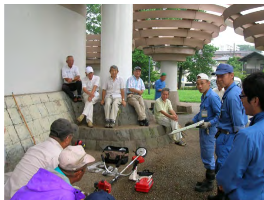
草刈機講習を受ける様子