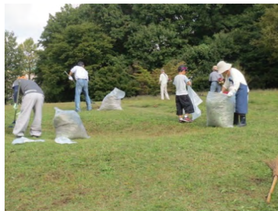
大人数での一斉清掃