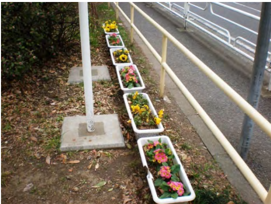
歩道側に置かれたプランターの花