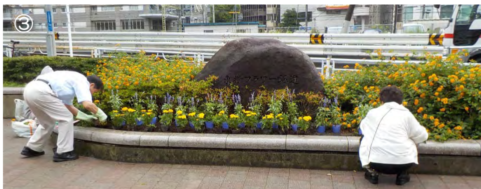
表紙写真：金沢区釜利谷緑道公園愛護会 作業後ほっと一息 裏表紙写真①：戸塚区谷矢部池公園愛護会 竹灯籠を日干し 裏表紙写真②：保土ヶ谷区上菅田第三公園愛護会 春の花壇 裏表紙写真③：神奈川区東横フラワー緑道第一公園愛護会 花壇の手入れ