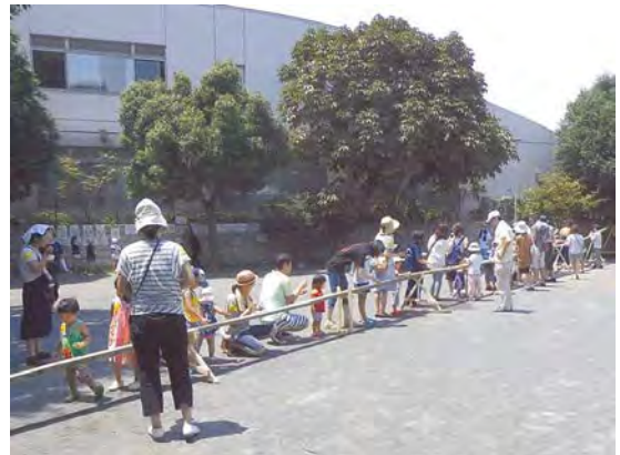
そうめん流しイベントの様子