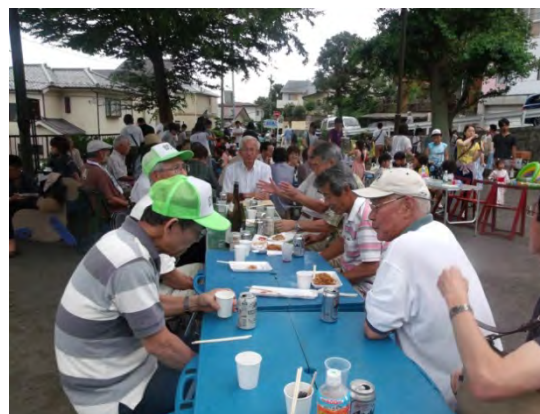
公園が地域交流の場になっている