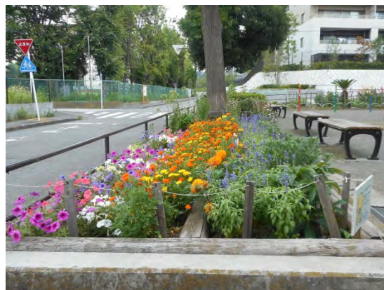
利用者からも愛される花壇