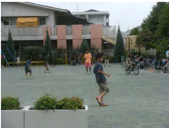
園内で楽しく遊ぶ子供たち