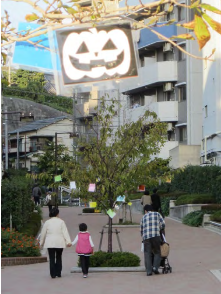
イベントごとの飾りつけも