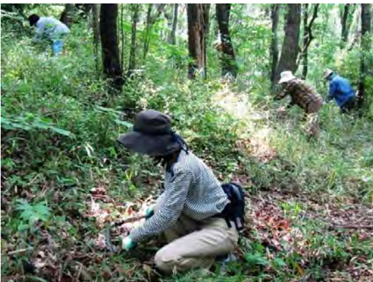
貴重な野草保護のためにササ刈りは手作業で