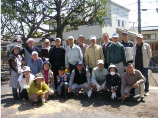
毎日誰かが清掃を行っている