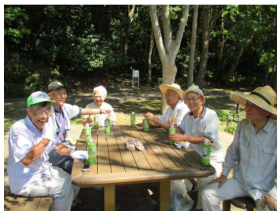
作業の後は、途中にある奥座公園でほっと一息