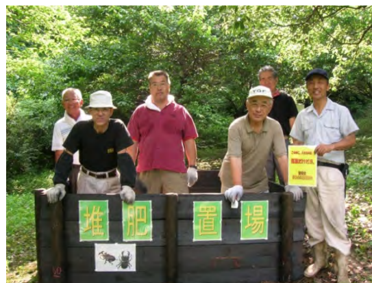
技術支援を活用した堆肥置き場づくり