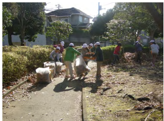
秋の大掃除の様子