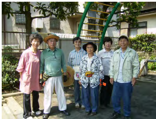
毎週集まるのが楽しみです