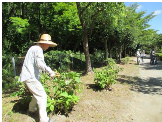
アジサイを剪定する様子