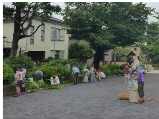
子供たちと清掃活動を行う様子