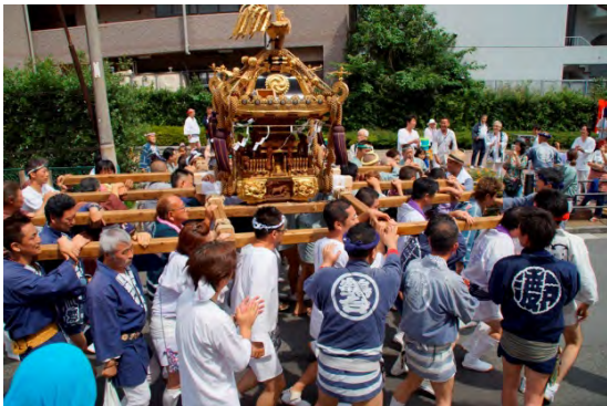
祭りのにぎわいの様子