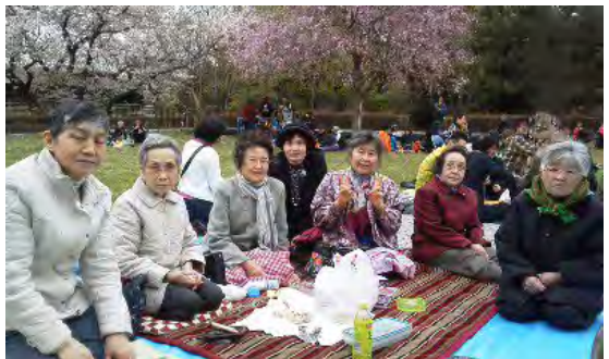
自治会とともにお花見イベントを開催