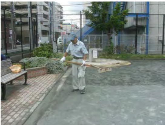
いつもきれいに整えています