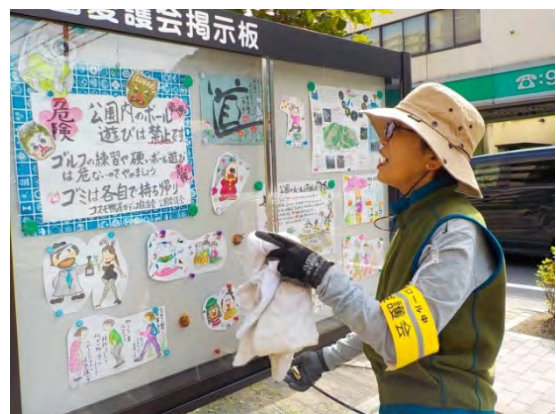
ユニークなポスターが並ぶ掲示板