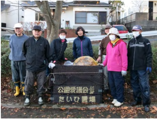
堆肥置き場づくりの様子