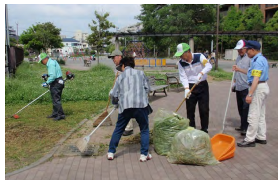
草刈機による草刈りの様子