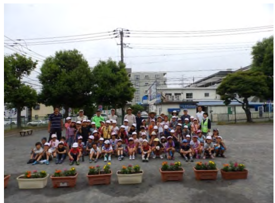
小学校との連携も盛んです