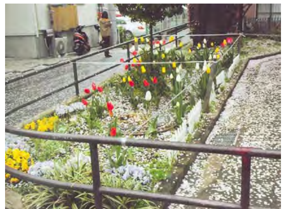
春には桜やチューリップがきれい