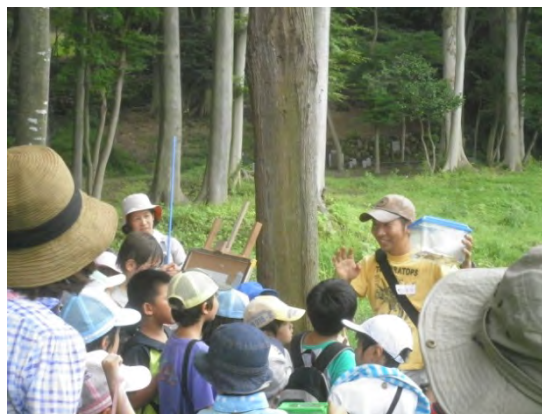
子供たちが自然と触れ合える場を提供