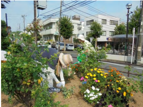
花壇の水やりや雑草拔きは欠かさない