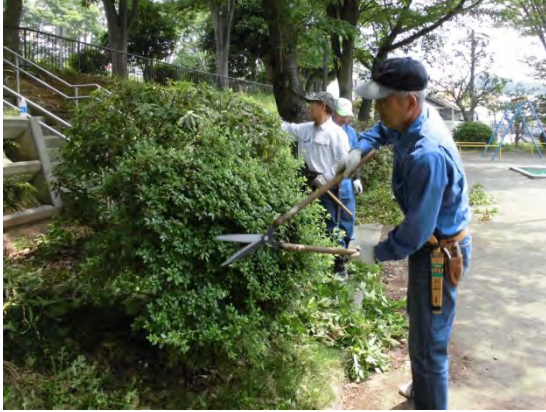
第一公園で中低木管理の講習を受ける様子