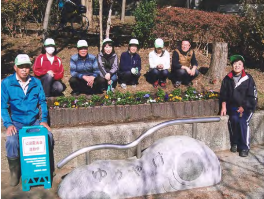
きれいな公園を目指す愛護会メンバー