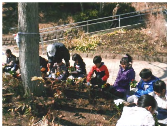
子供たちとの花植えの様子