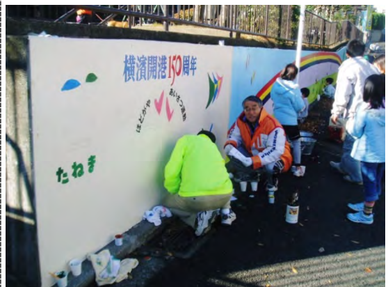
擁壁に壁画を描き、明るい雰囲気