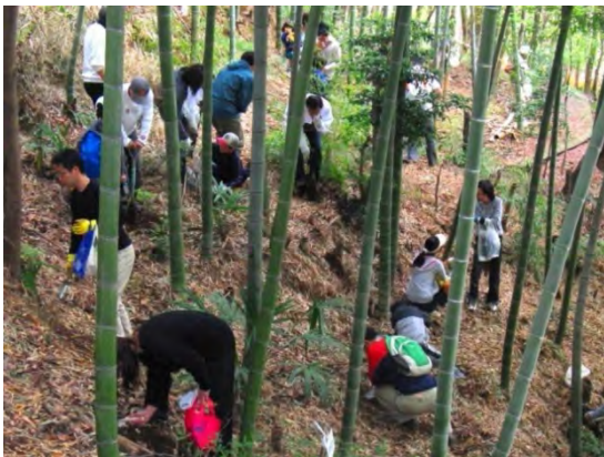
手入れの行き届いた竹林