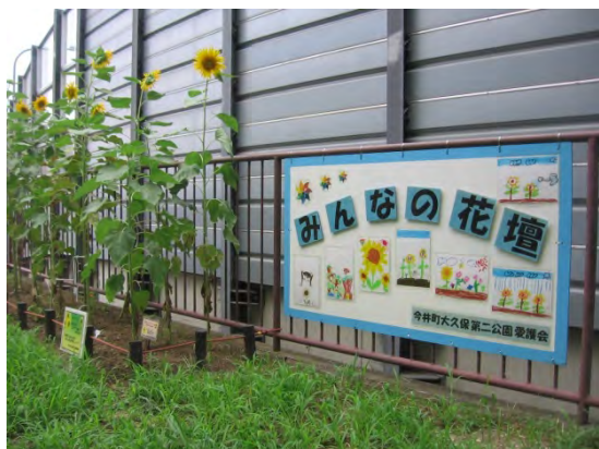
ヒマワリと並ぶ子供たちが描いた絵