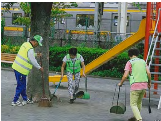
ごみやたばこの吸い殻をこまめに掃除