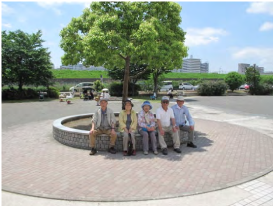
清掃の後、ひと休みする愛護会の皆さん