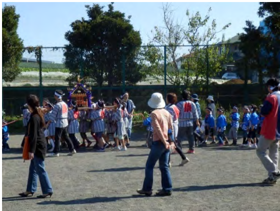
第二公園の秋祭りの様子