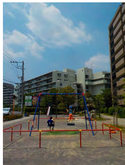
のびのびと子供たちが遊ぶ様子