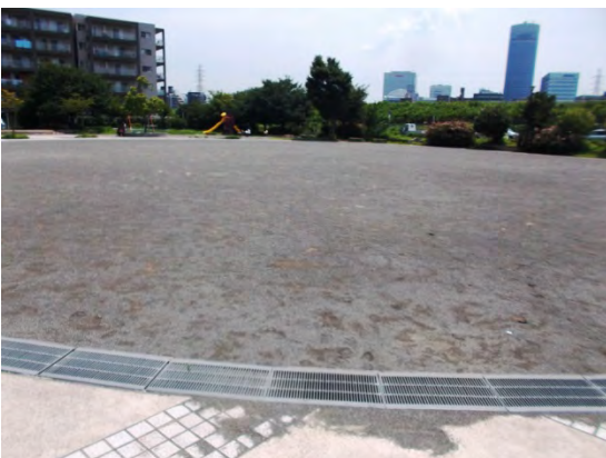
大きな広場のある公園