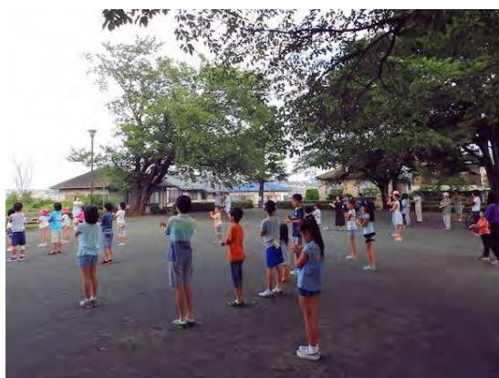
富士山に向かってラジオ体操