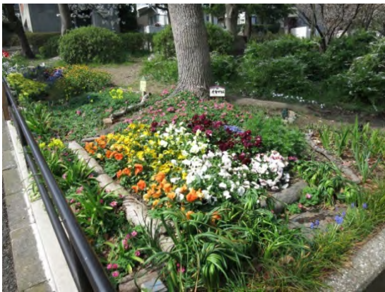
花壇づくりに熱心です