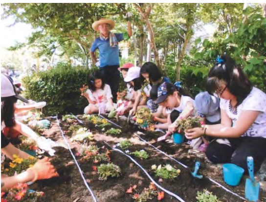
小学生との花植えの様子