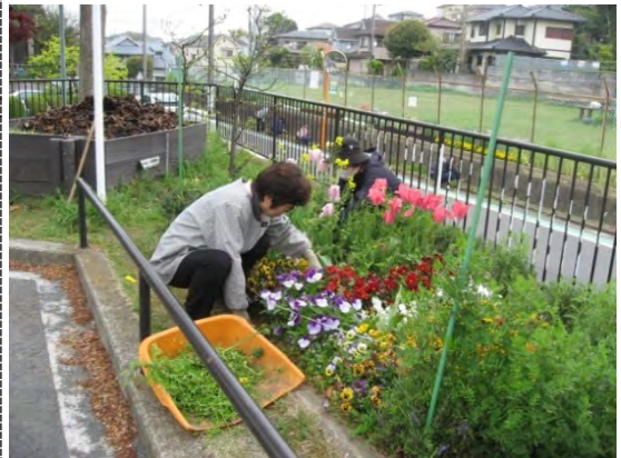
花壇は季節ごとに植替えを行います