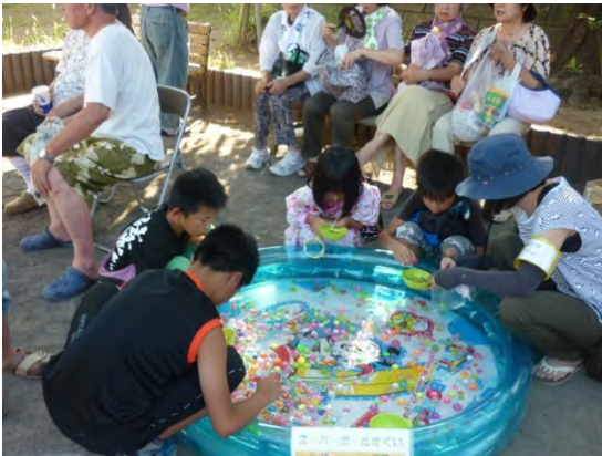
子供たちも夏祭りを楽しみにしている