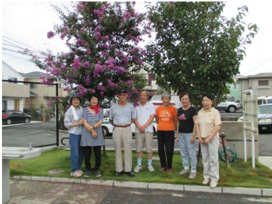
2つの公園をきれいにしています