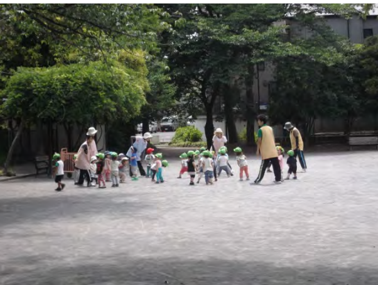
たくさんの保育園児が遊びに来る公園