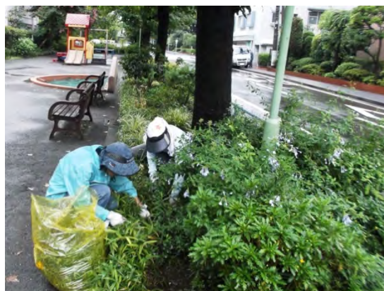
下草を丁寧に刈る愛護会の皆さん