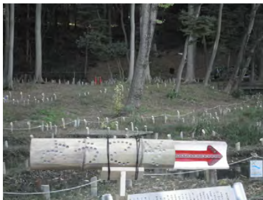
竹灯籠は、みんなで準備をします