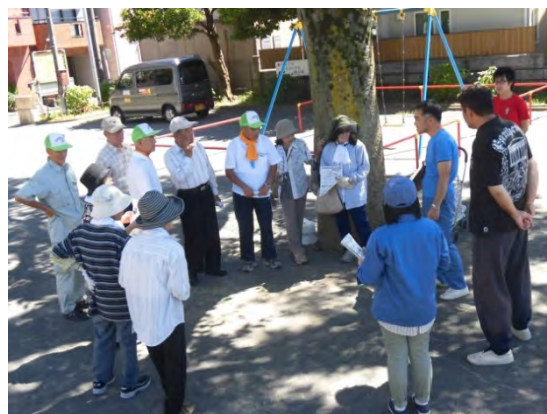
技術支援を受講する様子