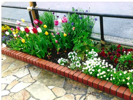
四季折々の花が咲く花壇