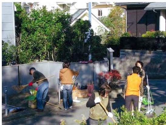
自治会全体で清掃活動を行っています