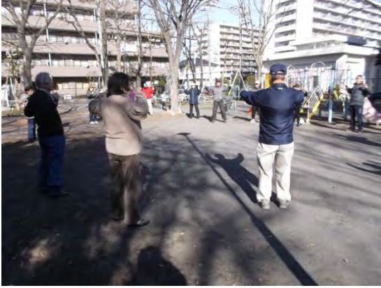
落ち葉かきの前に皆で準備体操