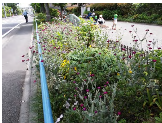
歩道に沿って手入れされた花壇