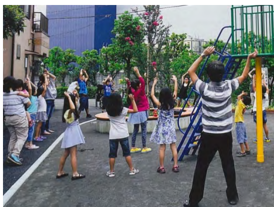
夏休みのラジオ体操の様子