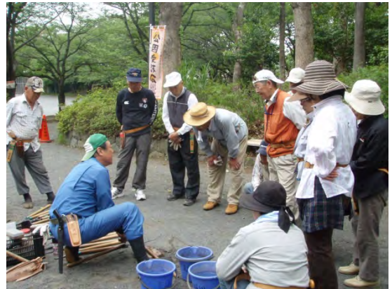
中低木管理の講習を受ける様子