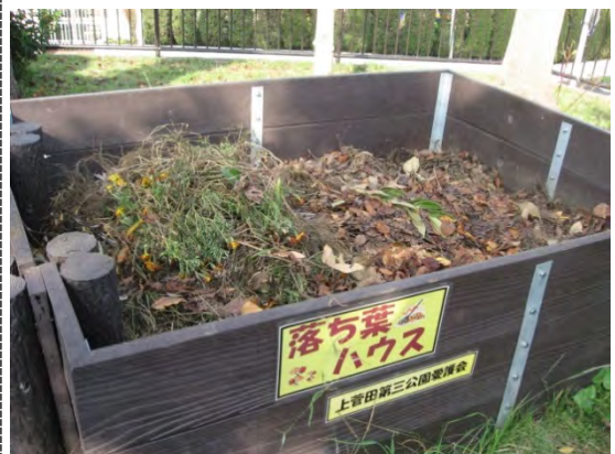
中にはカブトムシの幼虫がいます