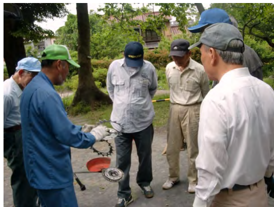
草刈機の再講習を受ける様子