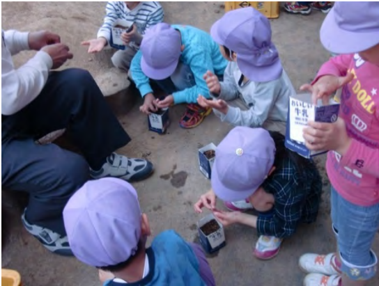
保育園児との牛乳パック種まきの様子