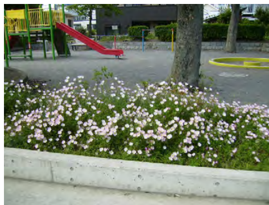
5月～7月は、こぼれ種で増えるヒルザキツキミソウがきれいです