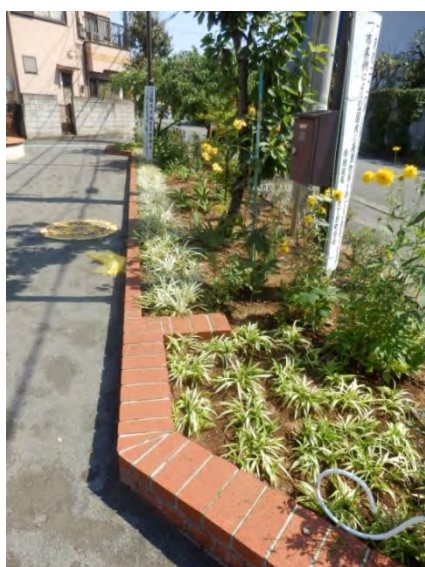
道路に面した部分もきれいに整えている