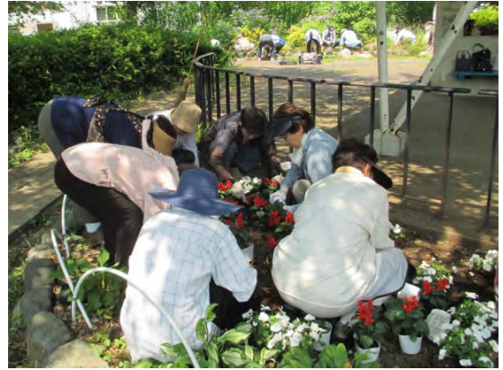
花壇の花植えの様子