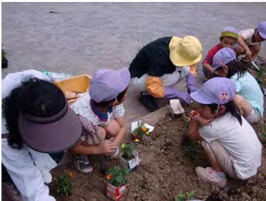
保育園児と育てた花を花壇に植える様子