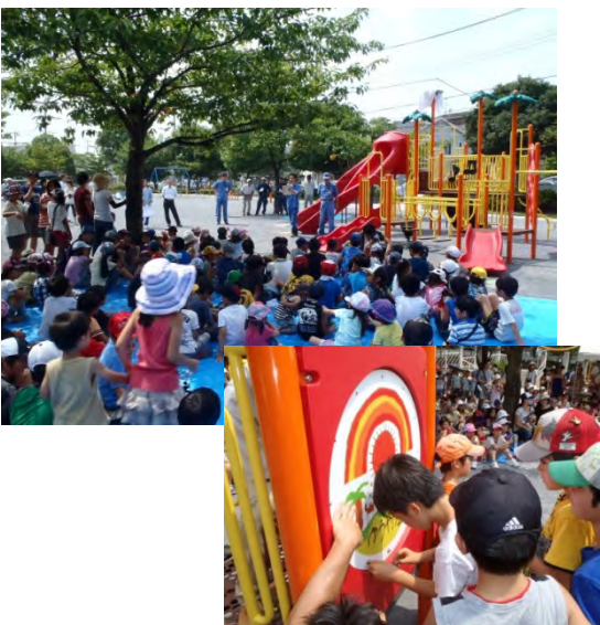
子供たちが描いたイラストの入った 新しい遊具のお披露目会