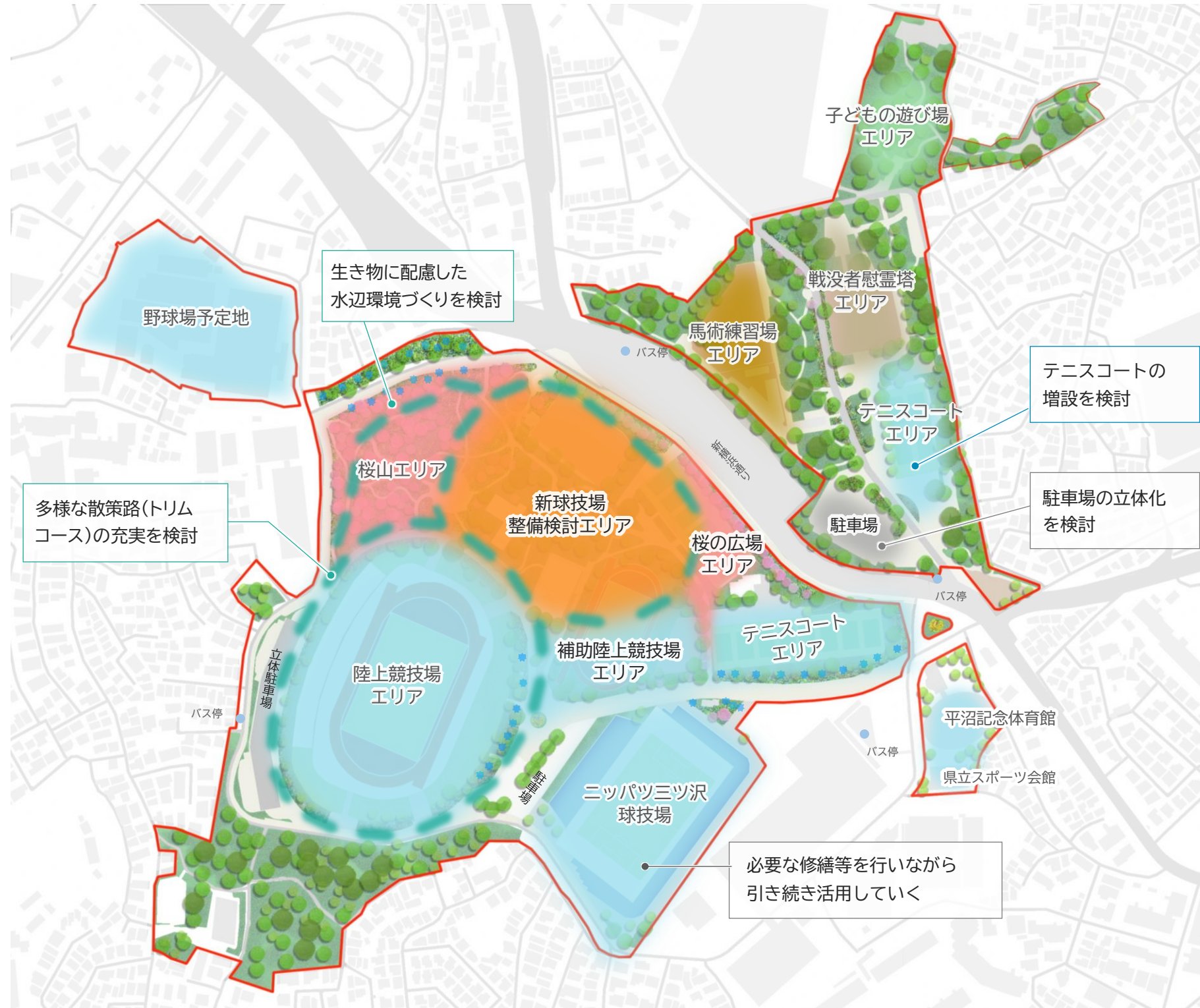
代替機能の確保を図る既存の施設や空間