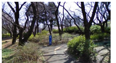
現在のトリムコース