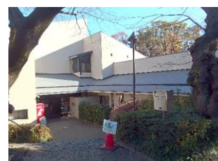
青少年野外活動センター