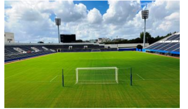
ニッパツ三ツ沢球技場