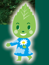
横浜みどリアップ 葉っぴー