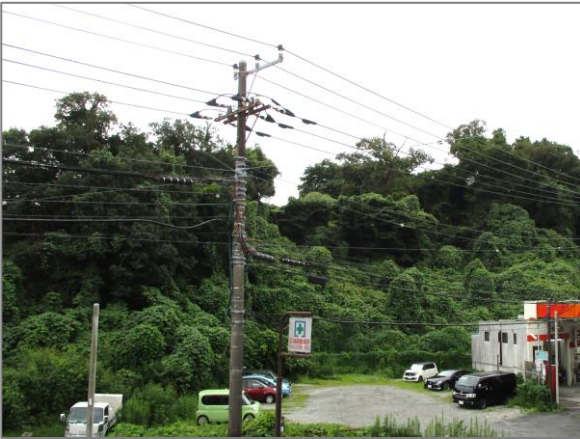
1 緑地保全制度による新規指定 源流の森保存地区（狩場町）