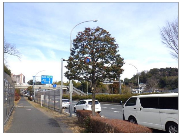
18 街路樹による良好な景観の創出・育成 （環状2号線）