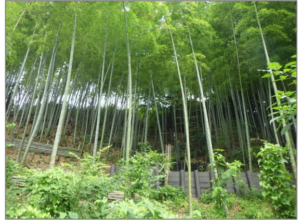
2 森の維持管理 （川島向台緑地）