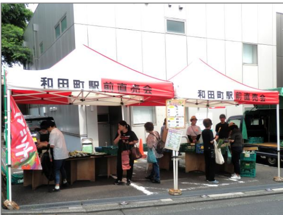
14 青空市・マルシェ等 （和田町駅前直売会）