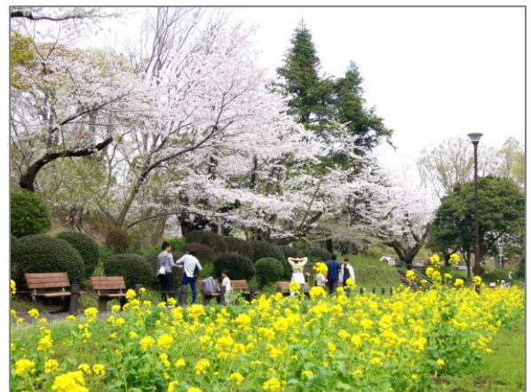
26 都心臨海部等の緑花による魅力ある空間づくり （横浜市児童遊園地）