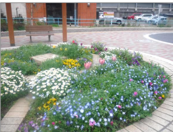
23 地域に根差した緑や花の楽しみづくり （帷子公園）