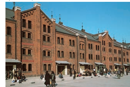
市が取得し、複合施設に再生・活用 [赤レンガ倉庫]