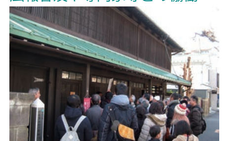
歴史的建造物の特別公開 [Open! HERITAGE IN 旧保土ヶ谷宿]