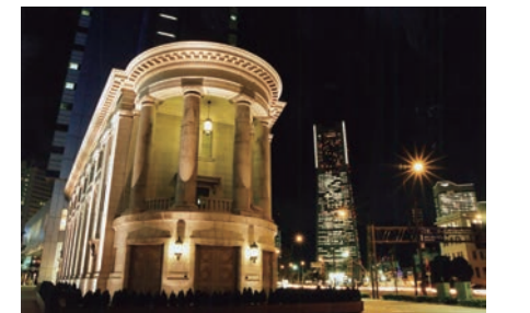
市民に魅力を伝えるライトアップ [旧横浜銀行本店別館 (元第一銀行横浜支店)]