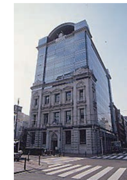
容積緩和制度を利用した外壁復元 [日本興亜馬車道ビル]