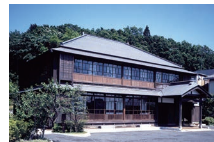
郊外部の里山景観を伝える古民家の保全 [旧清水製糸場本館 (天王森泉館)]