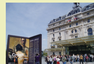
駅舎を美術館に (オルセー美術館 / フランス)

歴史的建造物の活用には様々な可能性があり、景観保全やにぎわい創出等の効果が期待されます。