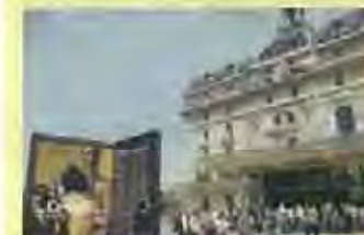
駅舎を美術館に(オルセー美術館/フランス)

歴史的建造物の活用には様々な可能性があり、景観保全やにぎわい創出等の効果が期待されます。