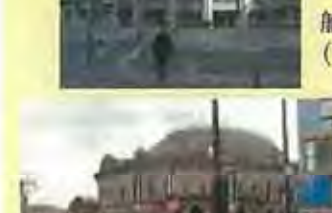
穀物取引所を複合施設に(コーンエクスチェンジ/イギリス)