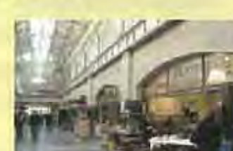
船着場をマーケットとオフィスに(フェリービルディング/アメリカ)