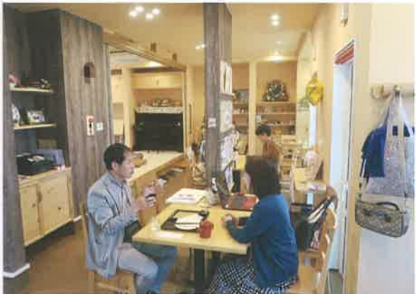
柵は知り合いの大工の手作り。内装にもこだわった。