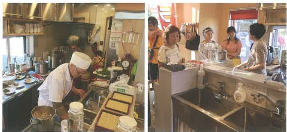
キッチンは外側にもシンクを設置し、子どもたちも食器洗いができるようにしている。

最高得票数で通過を果たしました。二次コンテストでは、実現性や地域まちづくりへの発展性も問われるため、町内会や公園愛護会など地域の団体の会合へ説明に回ったそ