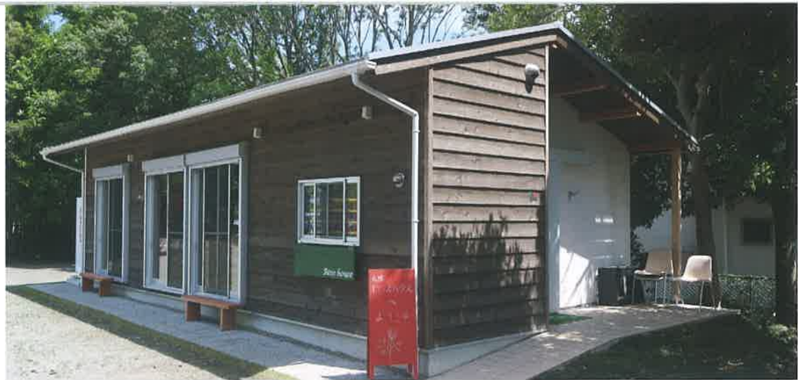
太陽ローズハウス。オープン時には赤い看板が掲げられている。

舞台は市営地下鉄あざみ野駅からバスで15分程の場所に位置する、荻子田太陽公園。230株のバラが咲き誇り、年に一度の「ローズフェスティバル」には3000人以上が訪れます。以前は荒れた公園でしたが、小学校のおやじの会がつつそうとしたツタなどを取り払い、さらに近隣に住んでいたイギリス帰りの住民の「市の花のバラを植えたらどうか」というアイデアをもとに、2001年より、有志で組織された「Joy of Roses(バラの会、以下JOR)」の手によってローズガーデンづくりが始まりました。