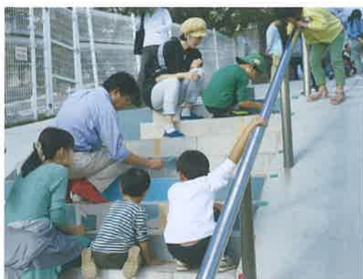
カラーリングは2日間のワークショップとして企画され、合わせて約70名が参加した。

り続けています。日本で初めて住民発意の建築協定※1をつくり、地区計画※2への移行に当たって遊歩道を歩行者専用道路に位置付けるなど、「まちは、そこに住んでいる人がつくりあげていくもの」という住民の想いと努力により、素敵なまち並みは開発後50年以上経った今も健在です。