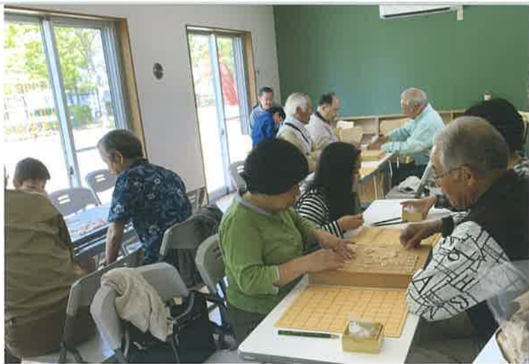
人気の将棋教室。地域に住んでいるシニア大会優勝者の強者が講師を担当している。

二次コンテストの前には、助成金の500万円では整備費用が足りないという課題が立ちはだかりました。コンテストに通過する前だったので、予約という形で寄付を集めに回ったそうです。ここに説明に行っても「本当にできるの?」と言われて、それに対して「JORのためではなく、地域のために」「できるで