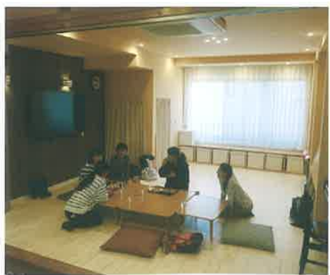
レンタルスペースは、講座などの利用に加え、友人同士の集まりなどにも使える。