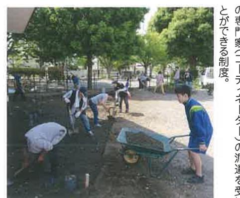
外構舗装には地域住民も参加して、土堀りやならしを行った。