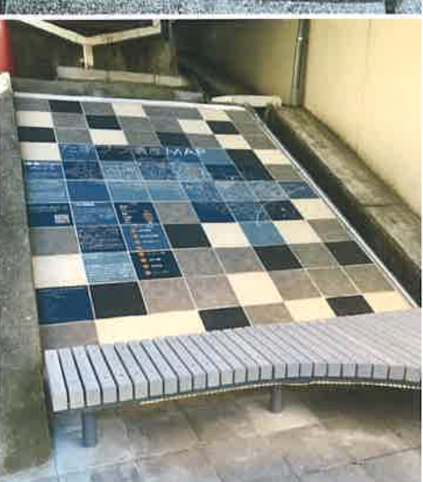
少し離れた場所からでも、カラフルな色彩で目を引く百段階段(左) 地域に点在する案内プレートには、百段階段の何段目の高さに当たるかが記載されている(右上) 情報看板前にはベンチを設置し、夜間はライトアップされる(右下)