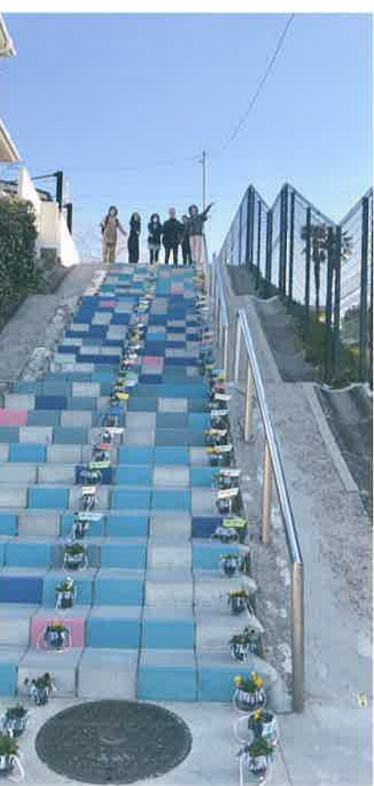
小学校の卒業式に合わせた「花の百段階段」。花のポットには「卒業おめでとう!」の旗がさされている。

百段階段のカラーリングとあわせて、百段階段をまちの「ものさし」にした案内プレートも整備し、まちのどつておきの場所を「たまプラー遺産」と名付けて「ここは階段の何段目にあたります」と書かれたプレートを設置することで、まちの標高を見える化したのです。また、暗い場所にはライトをつけて安心して通ることができるようになりました。