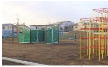
①-1 ゾウさん広場に設置されたジャングルジムと複合遊具。