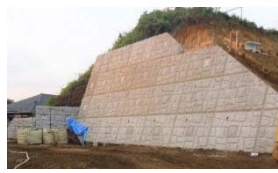
⑤ 公園南西部南側道路の法面。