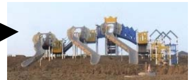
ゾウさん滑り台、右からパパぞう・ママぞう・子ぞう。