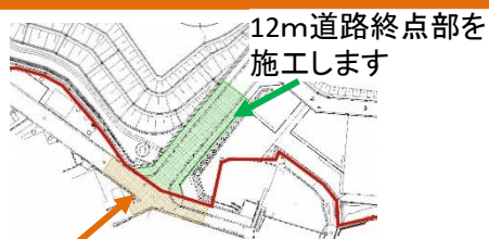
地区隣接の市道の舗装工事を行います

今後、地区南側の12m道路終点部(裏面にある図面の⑥)と地区に接続する既設道路の舗装工事を行っていきます。