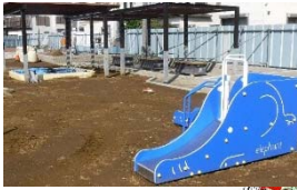
①-2 小さいお子さんも遊べる遊具・砂場。