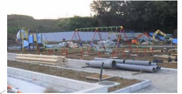
④ 多目的広場に隣接する公園1内のブランコと複合遊具。