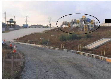
② 大原っぱの周回園路から見たゾウさん滑り台と大階段。