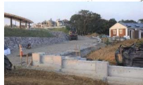
③ 12m道路入口から見た大原っぱ周回園路と左上には防災ベンチが付くパーゴラ(日よけ)。