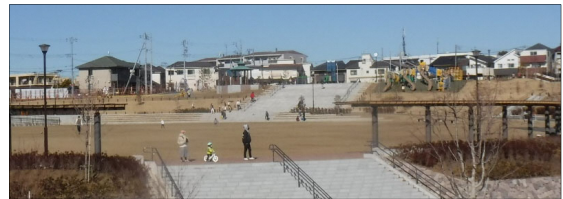
毎日多くの方々にご利用いただいています。

日頃から本事業に対するご理解、ご協力をいただきありがとうございます。 平成27年12月に着手し整備を進めておりました「鶴見花月園公園」が昨年11月に開園いたしました。これもひとえに地域の皆様のご支援とご協力の結果と深く感謝しております。開園後は連日多くの皆様に遊具や健康器具、大原っぱなどを利用し楽しんでいただいております。なお、1月14日より多目的広場の利用も開始しておりますのでご活用ください。 事業区域内においては、引き続き複数の工事を行ってまいります。地域の皆様には、今後ともご不便、ご迷惑をおかけいたしますが、安全第一に早期完了を目指して進めてまいりますので、ご理解、ご協力をよろしくお願いいたします。