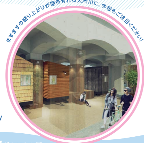
ますますの盛り上がりが見込まれる大岡川に、今後もご注目ください!

○ 利用時間や料金などの詳細についてはこちらをご覧ください。http://keikyutinyhousehostel.yadokari.net/