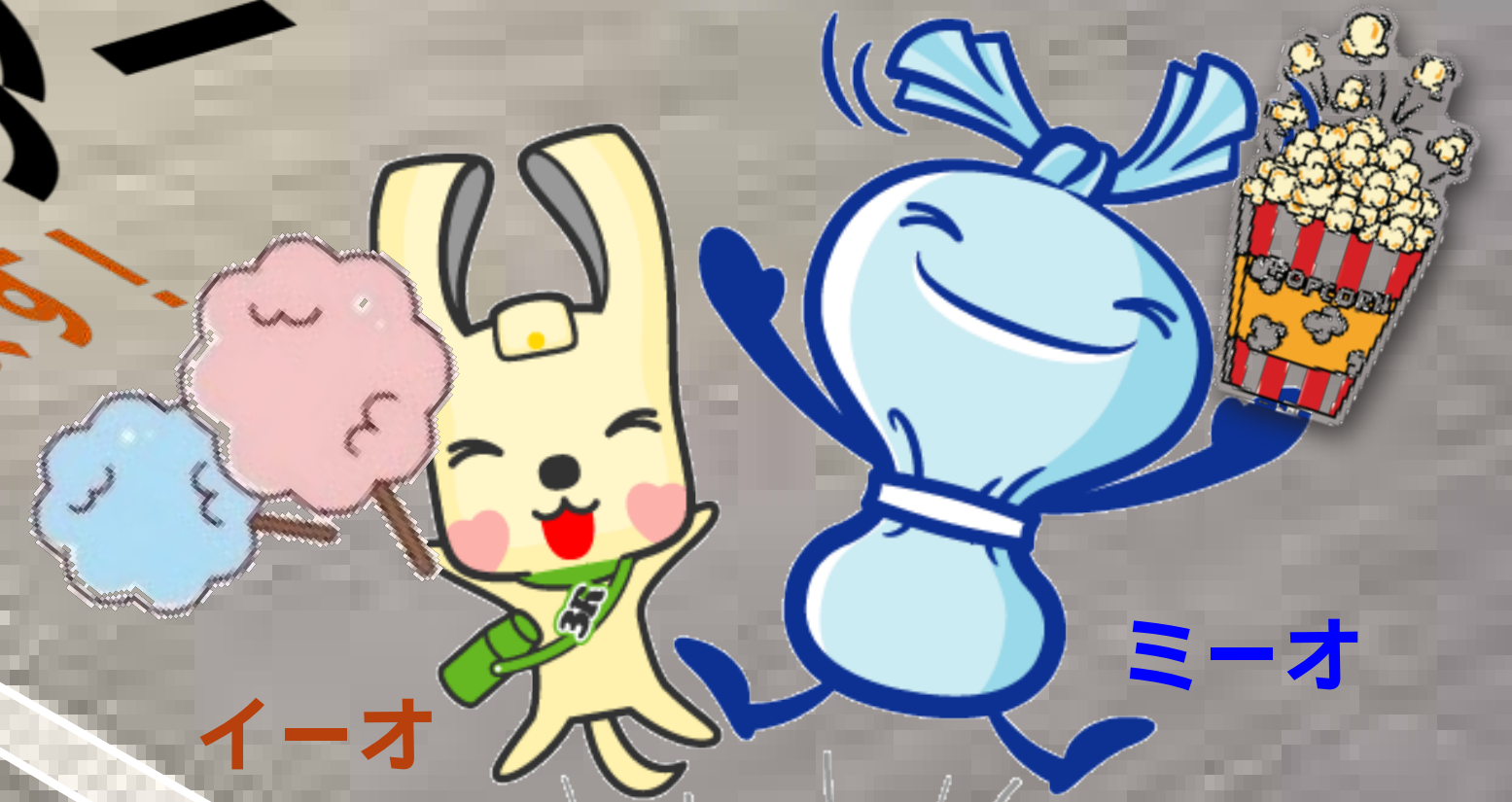
横浜市資源循環局マスコット