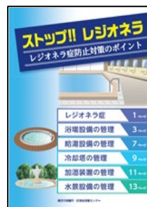
○啓発パンフレット

本市は、これまでも冷却塔の維持管理に関する指導を行ってききましたが、市内公共施設の冷却塔からレジオネラ属菌の指針値超過事例が散見されることから、維持管理方法の改善が必要な施設に対して指導を行います。また、全ての施設管理者に向けた動画等による冷却塔の適切な維持管理方法の啓発を行います。