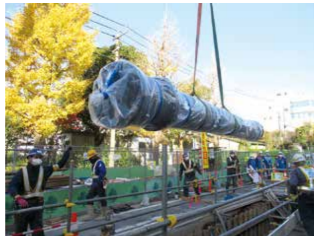
送配水管の更新工事