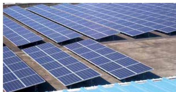
太陽光発電設備(川井浄水場)