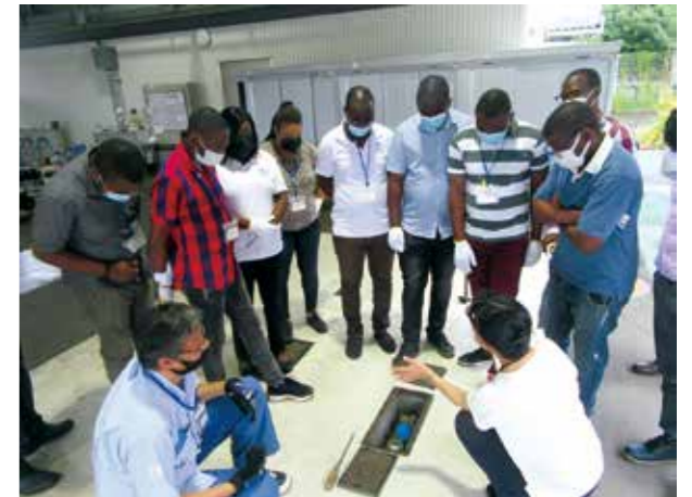
アフリカからの研修生の受入の様子