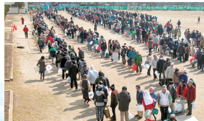
▲給水所で順番を待つ人々(仙台市)

なお、体を清潔に保ったり、洗濯をするための生活用水については、飲料水と別に確保する必要があります。