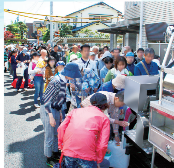
▲給水車から給水を受ける人々(熊本市)