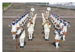
▲横浜市消防音楽隊

6月から10月まで、横浜市消防音楽隊が市内の27の中学の吹奏楽部でワークショップを行って、中学生たちに教えています。これはわかい人たちが音楽にしたしむためのとりくみです。ワークショップに参加した中学生が「街に広がる音プロジェクト」に出て、みんなに見せてくれます。