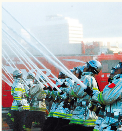
压卷的同时放水值得一看