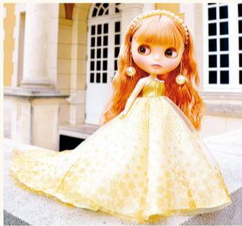
布莱丝 © 2016 Hasbro. All Rights Reserved. Licensed by Hasbro

今年迎接的布莱丝(玩偶)15周年将在「横滨玩偶之家」汇聚一堂。至今为止诞生的布莱丝,大约500个。以从中遴选的玩偶为中心,来展示。