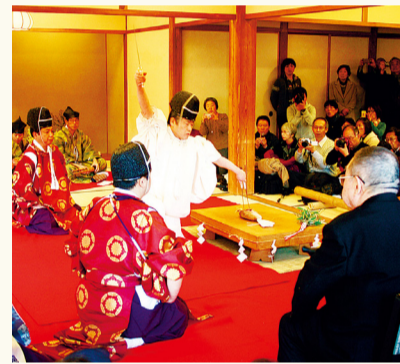
不用手抚摸,只使用筷子和刀妥善处理食材的传统仪式,刀工仪式

将平时看不到的市指定有形文物的鹤翔阁(旧原家住宅)的内部在正月期间公开。曾经,有横山大观、下村观山这样的日本美术院的画家为了创作活动在这里逗留过的具有历史意义的珍贵场所。在此期间,还进行箏曲演奏以及刀工仪式。