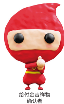
给付金吉祥物 确认者