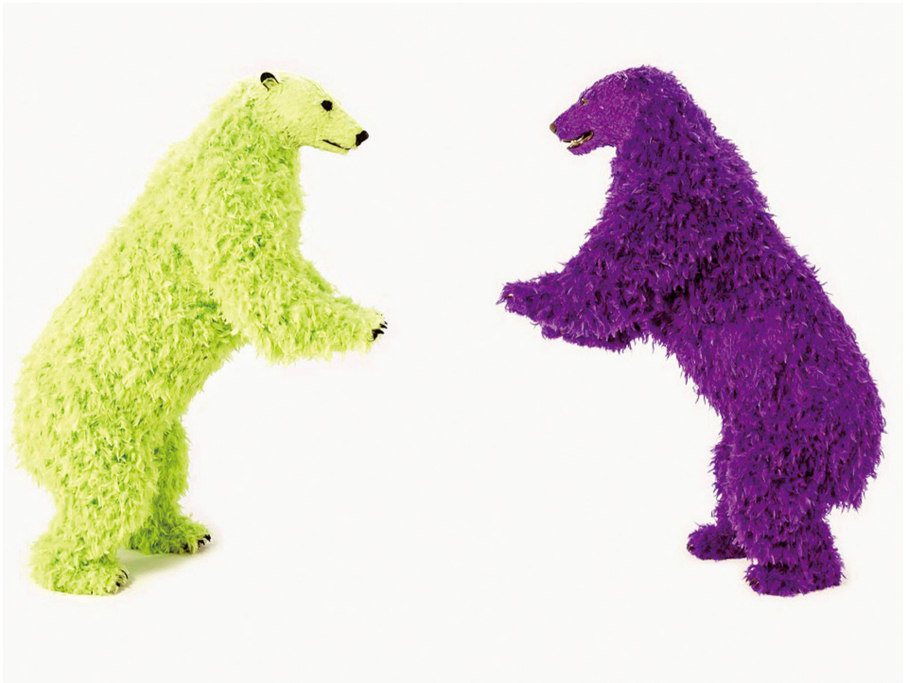
波拉·彼薇《I and I (must stand for the art)》2014