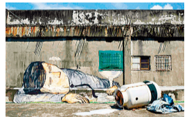
糖果鸟 《Office Worker》2016