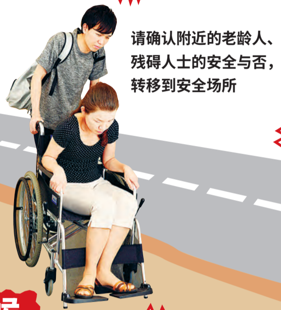
请确认附近的老年人、 残障人士的安全与否， 转移到安全场所