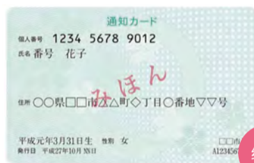
通知卡的样品 通知个人编号(个人编号)的卡片

【垂询】市呼叫中心 电话:045-664-2525 传真:045-664-2828 或者区政府户口科