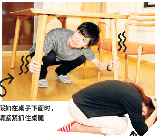
假如在桌子下面时， 请紧紧抓住桌腿