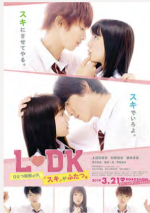
© 渡边站 / 讲谈社 © “2019 L♡DK” 制作委员会

让“壁咚”成为大众流行的电影“L♡DK”。在学校里最帅的柊聖(杉野遥亮)和一起过着同居生活但对外保密的主人公葵(上白石萌音)。有一天柊聖的表妹玲苑(横滨流星)突然来了，就这样开始3个人的同居生活！在象鼻公园和ENOKI亭等处，与2014年公开的上一个作品一样，在横滨各地开始了拍摄。