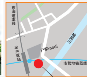
户塚站东口行人甲板