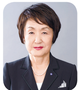
横滨市长 林 文子

1月底，我们公布了总额达2万73亿日元的2021年度预算案。此次预算编制的中心思想是在史无前例严峻的财政状况下，将保护市民的宝贵生命和生活放在第一位，努力实现强有力的经济复兴，为横滨的未来发展作贡献。