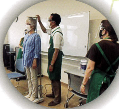
▲霧が丘健康チェックの日