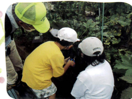
▲霧の里での収穫体験の様子

小中一貫校である霧が丘学園では1年生から9年生の児童・生徒が、地域の方々に温かく見守っていただきながら、健やかに成長しています。昔遊びや読み聞かせ、交通安全・防災教育等の機会もいただいています。児童・生徒が大きな事故や犯罪に巻き込まれずに過ごせているのは、地域の皆様の日ごろのパトロールや見守り活動のおかげです。この場をお借りして、皆様に深く感謝申し上げます。