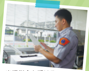
▲出場指令を受ける緑消防署の救急隊員

119番通報は、保土ヶ谷区にある司令センターにつながります。その後、 要請場所から一番近い救急隊 に「出場指令」が出されます。