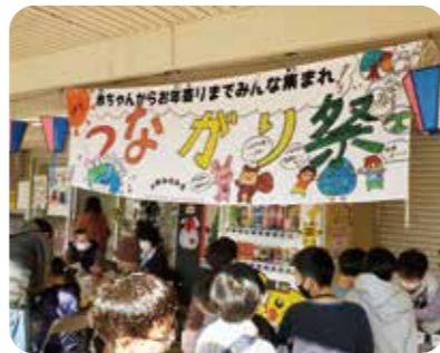
多世代交流イベント「つながり祭」