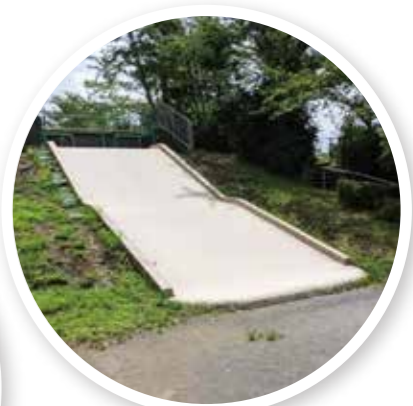
じゃんぼ公園★ 大きなすべり台があります