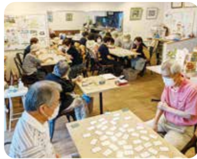
高齢者の居場所「百人一首の集い」