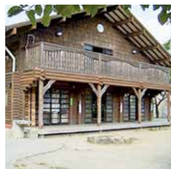
こどもログハウス