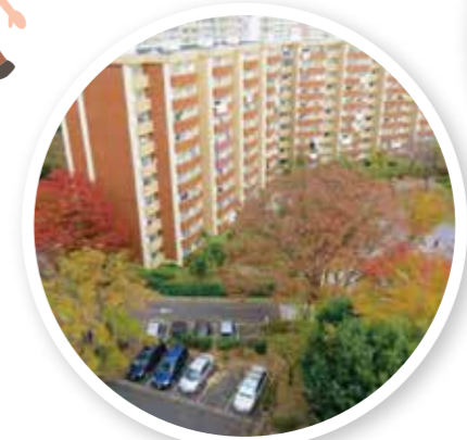
南永田団地と紅葉