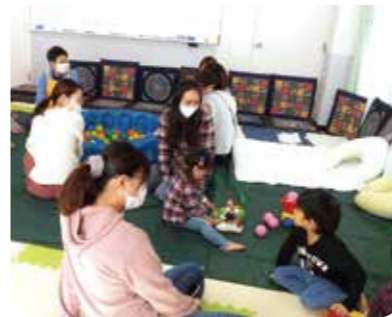
子育てサロン「まんま」