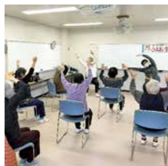
元気づくりステーション 「永田ふれあい塾」