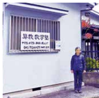
♥ 子どもの居場所「算数・数学塾」