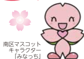
南区マスコット キャラクター 「みなっち」