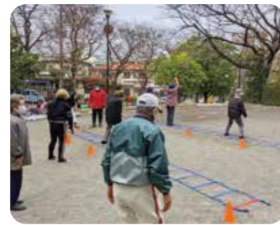
脳トレウォーキング等のフレイル予防活動