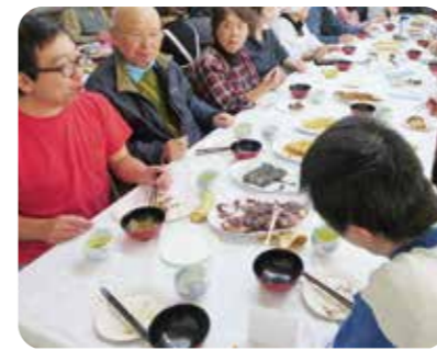
障害者地域作業所「めざみ」との交流会