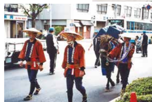
助郷行列パレード