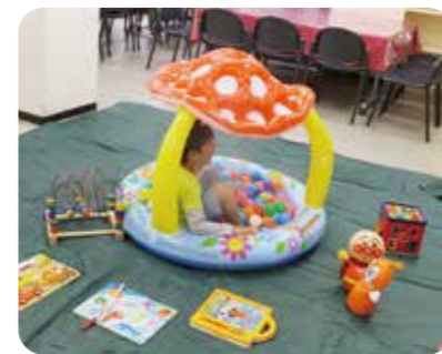
子育てサロン「ぼてと」