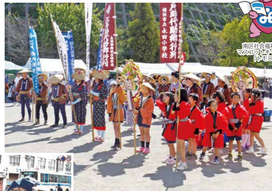
ふるさとふれあいまつり