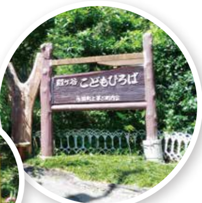
殿ヶ谷子どもの遊び場