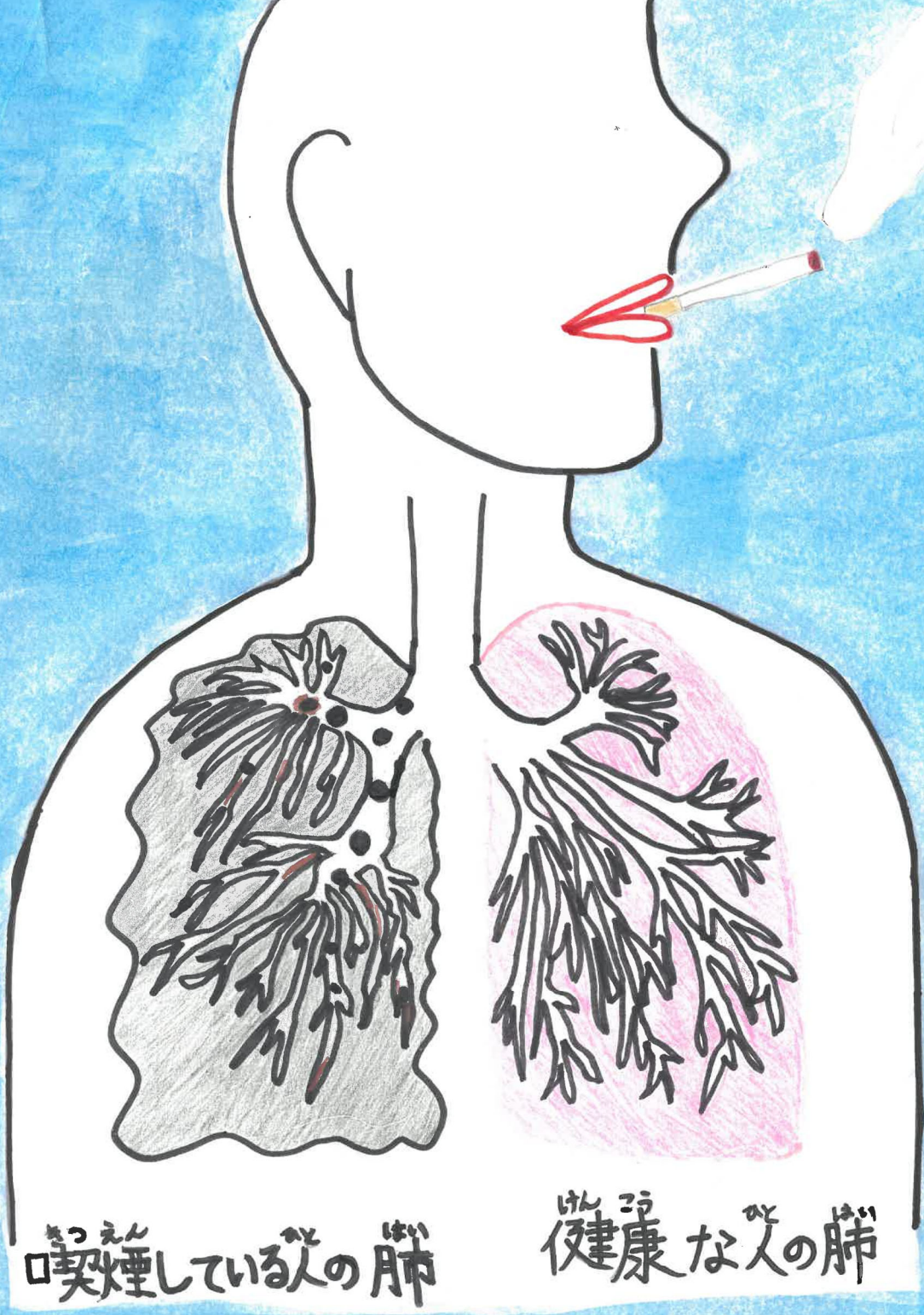
喫煙している人の肺