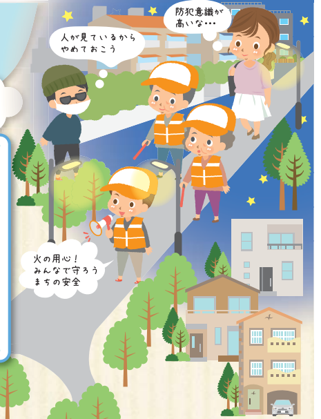
夜間もまちを見守ります

防犯や防火のために自治会町内会の皆さんで見回りをしています。防犯意識の高いまちは狙われにくいといわれています。