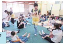
子育てサロンで楽しく交流

まちに住む子育て世帯が集まりやすい場所を作り、子育てを通じた地域のつながりを作っています。