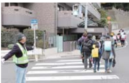
交差点や通学路で登下校を見守り

危険な交差点や人けの少ない通学路で、子どもたちが安全に通えるように、毎日見守ってくれる自治会町内会の人があります。顔見知りの近所の人だと安心ですね。