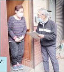
「お変わりないですか?」と見守り訪問

1人暮らしの高齢者を訪問したり、地域の皆さんが集う高齢者サロンなどに誘うなど、自治会町内会はまちに住む高齢者を見守っています。