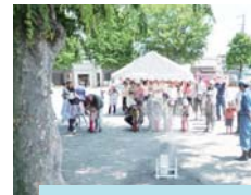
もしものときに備えて防災訓練

もしものとき、隣近所で助け合えたら安心ですね。自治会町内会では独自に防災訓練の実施や防災備品を用意し、日頃の交流から地域のつながりを作っています。