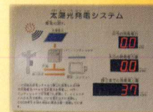
太陽光発電表示板