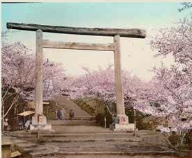
桜咲く伊勢山皇大神宮 明治期