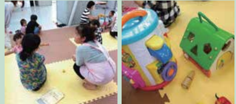
家族のこと、保育園のことなど、何でも気軽に相談できる

黄金町周辺では数少ない子どもの遊び場。保護者が子育ての大変さから解放され、ホットする場になっています。「気軽に相談できて助かります。とても安心できる場所です」と参加者も笑顔。最後はおうちでもできる手遊びや親子遊びを紹介します。