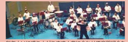
毎年大いに盛り上がります！曲に合わせて楽器紹介も

🕒12月21日(土)14時～15時30分 📍本牧地区センター体育室(📍本牧原) 📍同センター ☎️622-4501 📠622-4828