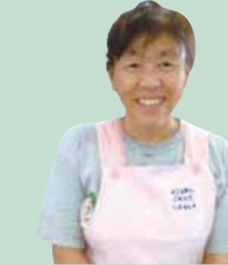
おもちゃも充実しているので、どんな年齢の子でも楽しめるものがあるはず!