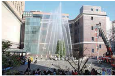
大迫力の一斉放水

新春を飾る消防出初式で中区の安全・安心への決意を新たにします。式典、消防署・消防団による訓練の演技や消防体験コーナーなど。🕒10時～11時30分 📍横浜情報文化センター(日本大通り駅③出口)と周辺 📍中消防署 ☎️251-0119