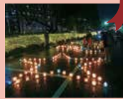
手作りのクリスマス

手作りキャンドルがともる中、ホットワインや軽食(15時～)を楽しみながらジャズの演奏(17時～18時)を聴きませんか。