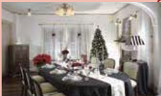
装飾のほか、ワークショップやコンサートも

🕒12月1日(日)～25日(水)9時30分～18時※金曜・土曜と22日・23日・24日は19時30分まで 📍エリスマン邸を除く西洋館各館と旧山手68番館 📍横浜市イギリス館 ☎️623-7812