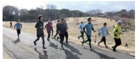
昨年、根岸森林公園などで開催し好評だった講座を、場所を変えて開催

フォームや完走のコツ、トレーニング方法を指導。*横浜マラソン出走権は全回参加者から抽選(参加料15,000円は別途) 🕒13時～16時 📍山下公園と周辺 📍50人※2002年4月1日以前に生まれた中区在住・在勤・在学の人 料3,000円 申12月24日(火)までにHPで。抽選 問中スポーツセンター ☎️625-0300 📠624-1969