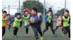
経験レベルに合わせて練習します

YC&C/中区ラグビー教室 日本ラグビー発祥の地であるYC&C(横浜カントリー&アスレティッククラブ)のグラウンドに元ラグビー日本代表選手を講師に迎え、小学生向けのラグビー教室を開催します。📅10時~12時※荒天中止 📍YC&Cグラウンド(山手駅) 📍小学生200人 ☎1月11日(土)からHPで 📍同クラブ ☎623-8121 📠623-1233