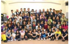
物語の舞台は中区・妙善寺。初代「若が代」と日本吹奏楽発祥の地！

文明開化の波が押し寄せる横浜。外国人居留地から始まった「どんたく」。そこには時代の光と影、夢を追いかける少年たちの物語がありました。日本の吹奏楽事始めの歴史と共に描くハートフルミュージカル。📅①11時~13時10分、②16時~18時10分 📍関内ホール大ホール 📍各900人 ¥各2,500円(高校生以下1,500円) ☎電話・FAX・Eメール(☎・📠・📮)一般/高校生以下それぞれのチケット枚数を記入で ※中学生以下の場合は保護者申込 📍実行委員会事務局(赤い靴記念文化事業団内) ☎641-3066