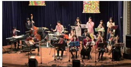
冬でも熱いステージを楽しみましょう

アマチュアジャズバンドフェスティバル 8回目となる冬の陣。アマチュアバンドが演奏の腕を競います。📅11時30分~20時30分 📍開港記念会館講堂 📍200人 ¥1,500円(前売り1,000円) 📍実行委員会 ☎080-4361-8427 📠264-9004